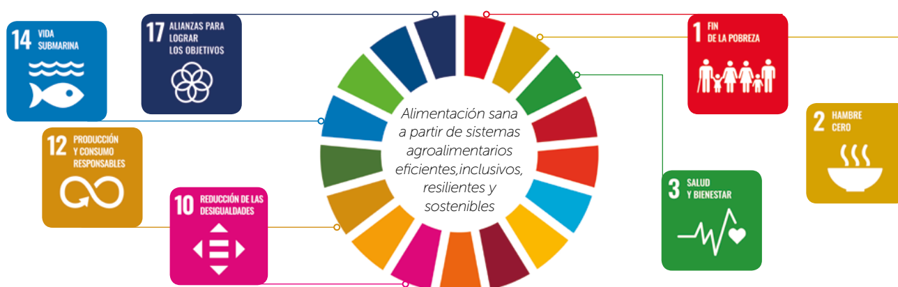
Figura 1: La misión de la FAO en el ámbito de la nutrición contribuye al logro de numerosos Objetivos de Desarrollo Sostenible