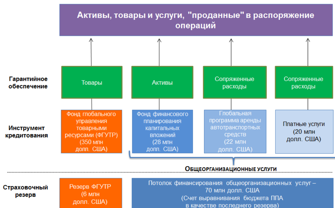
Рисунок 2. Финансирование операций по созданию запасов и общеорганизационные услуги

ограниченных внутренних ресурсов для покрытия финансовых рисков, уделяя особое внимание управлению рисками, связанными с ФГУТР.