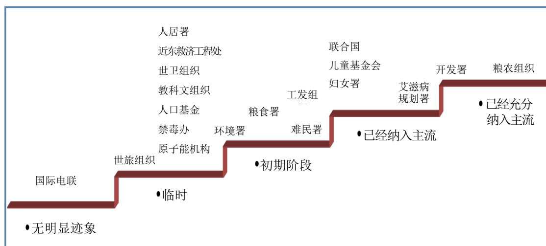
图 1 联合国系统各组织主流化程度的全面分析

71. 分析表明，联合国系统中接受本次审查的大多数组织(19 个组织中的 9 个，几乎占 50%)可归于就体面工作采取了“临时举措”一类。在原子能机构、人口基金、禁毒办、近东救济工程处和世卫组织等组织，体面工作问题构成了十分具体的工作领域。在原子能机构和世卫组织，上述领域涉及支柱 3(工作中的标准和权利)和社会保障。在禁毒办和近东救济工程处，检查专员观察到与体面工作相关的活动涉及支柱 1(创造就业和企业发展)。人口基金在支助 2(社会保障)方面开展了有效的工作。将世旅组织置于“无明显迹象”和“临时举措”之间的过渡区域，是因为尽管该组织明确开展了为消除贫困发展可持续旅游业的具体工作，但是它负有就体面工作议程所有四个支柱开展工作的任务，因此检查专员认为它应该更积极地将体面工作纳入其活动。