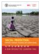
SOCIAL PROTECTION, EMERGENCY RESPONSE, RESILIENCE AND CLIMATE CHANGE (社会保障、应急响应、韧性和气候变化) A new interactive learning tool (新的互动性学习工具)

意见书讨论了社会保障能够在保护人们的生计的同时加强家庭应对、处理和抵御威胁与风险的能力之中发挥的作用。意见书侧重说明社会保障在长期危机、脆弱境况和人道主义援助中所能扮演的角色，以及讨论具有突发情况响应力的系统的重要性，哪怕在稳定的环境中。