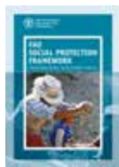
FAO SOCIAL PROTECTION FRAMEWORK (粮农组织社会保障框架)

该出版物说明了组织对于社会保障的愿景和方法。粮农组织认可了社会保障在推进和加快粮食安全和营养、农业发展、改善农村贫困和韧性建设方面发挥的重要作用。