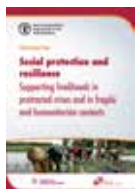
FAO POSITION PAPER ON SOCIAL PROTECTION (粮农组织社会保障意见书): Supporting livelihoods in protracted crises, fragile and humanitarian contexts (在长期危机、脆弱境况和人道主义援助中支持人们的生计)

这一诊断工具帮助使用者发现一个国家中农业和社会保障干预之间的联系，以及如何加强这些联系。该工具还能够帮助使用者体会和感知两部门之间的联系以及这种联系（紧密或不紧密）对于他们的生活的影响。