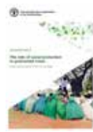
THE ROLE OF SOCIAL PROTECTION IN PROTRACTED CRISES (社会保障在长期危机中的作用) - Enhancing the resilience of the most vulnerable (加强脆弱人群的韧性)

这一工具包由三个技术指引组成，目的是帮助社会保障和性别方面的政策制定者和工作者，系统地考虑性别差异问题，降低性别相关的社会不平等、农村贫困和饥饿。