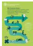
TECHNICAL GUIDANCE TOOLKIT ON GENDER-SENSITIVE SOCIAL PROTECTION (关于考虑性别问题的社会保障的技术指引工具包)

这一互动性学习工具旨在帮助全国利益相关方和政策制定者学习和了解在地方、国家和全球层面将社会保障与韧性和气候变化政策相关联的潜在好处和取舍。这一工具抓住了现实的复杂性，模拟了小规模农场主面临的冲突和威胁。