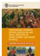
STRENGTHENING COHERENCE BETWEEN AGRICULTURE AND SOCIAL PROTECTION (加强农业和社会保障之间的连贯性): Framework for Analysis and Action (分析与行动框架)

该出版物说明了组织对于社会保障的愿景和方法。粮农组织认可了社会保障在推进和加快粮食安全和营养、农业发展、改善农村贫困和韧性建设方面发挥的重要作用。