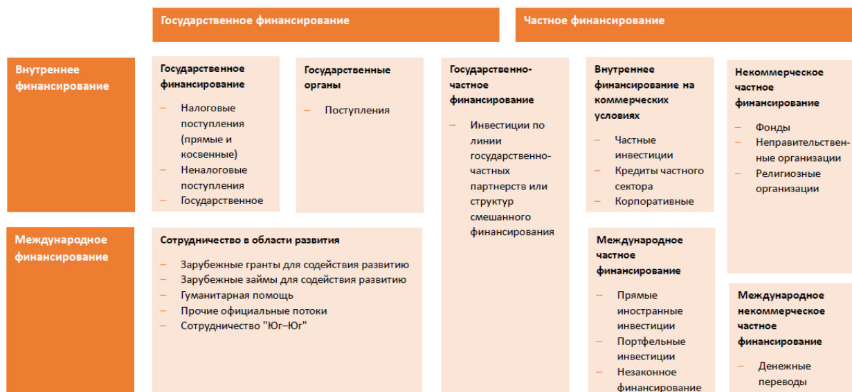
Рисунок 1. Главные источники и виды государственного и частного финансирования развития