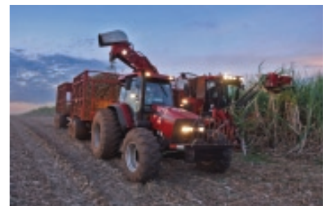
Récolte de canne à sucre pour la production d'éthanol au Brésil.