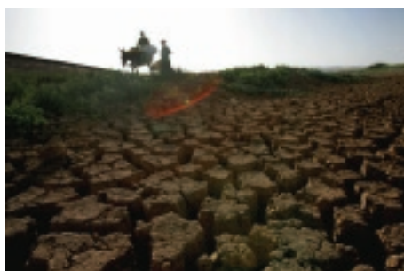
Désertification: un milliard de personnes à risque.

L'utilisation durable des ressources naturelles - en particulier terres, eaux, ressources forestières, halieutiques, génétiques et biodiversité - est fondamentale pour le développement économique et social. La FAO dispense des avis techniques et de politique pour affronter les principales menaces pesant sur les ressources naturelles: dégradation des terres, pénuries d'eau, déforestation, surpâturage, surexploitation des ressources marines, accroissement des émissions de gaz à effet de serre et pertes de ressources génétiques et de diversité biologique. La FAO appuie également les efforts de développement durable dans les zones fragiles et marginales telles que les terres arides et les zones montagneuses et côtières, où sont concentrés la majorité des pauvres. L'Organisation met au point des ripostes améliorées pour relever les défis environnementaux mondiaux ayant trait à l'alimentation et à l'agriculture, notamment les changements climatiques, les bioénergies et la biodiversité.