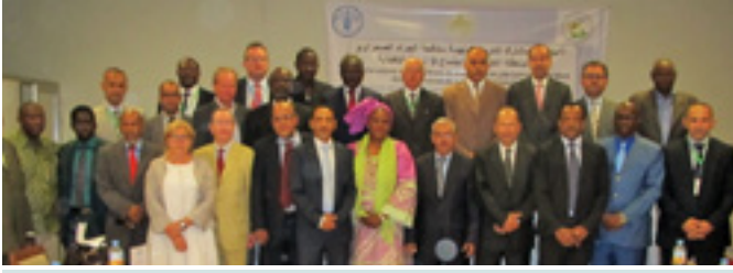
المشاركون في الدورة السابعة للهيئة لمكافحة الجراد الصحراوي

تعتبر ميزانية الدول أولى وسائل التمويل مع مراعاة هدف الدعم الكامل للمصاريف المتكررة في مكافحة الوقائية من طرف هؤلاء ( البالغة حاليا 65 % ). وقد قرر المندوبون كذلك دعم الدول التي تعيش أزمة، وفق شروط معينة، وذلك بدعم الصندوق الإستراتيجي للهيئة كل مقاومة وقائية بما قدره 100000 دولارا سنويا على أقصى تقدير. كما أقر أيضا مبدأ مضاعفة تمويل الصندوق الاقليمي للحد من خطر الجراد، من طرف صندوق الاستثمار للهيئة بما يناهز 100000 دولارا سنويا عند ظهور الجراد او بدء ظهوره وهي فترات حرجة يمكن أن تؤدي إلى انتشار زحف الجراد وبالتالي إلى أزمات غذائية. ستعقد حملة تحسيسية في الأشهر والسنوات المقبلة من أجل دعم هذه الآلية الاقتصادية في نطاق التعاون جنوب-جنوب خاصة. مع الملاحظ أن تصاعد نسبة التملك من طرف الدول الاعضاء في تصاعد مادامت نسبة مساهمتها في الصندوق الاستراتيجي للهيئة في ارتفاع بما يقارب 500000 دولارا في 2013 على مجمل 639000 منتظرة. قد أقر المندوبون باتفاق مع البلد المضيف الجزائر تنظيم اجتماع الوزراء المكلفين بمكافحة الجراد في صلب الدول الأعضاء في هيئة مكافحة الجراد الصحراوي من أجل استراتيجية الوقاية وإرساء سبل تمويل مستدامة لمكافحة الجراد في المنطقة.