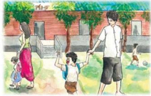
ہامی آزاد تجارت کے خلیے ذریعہ بچوں کے لئے تکمیل کا میدان اور کتب خانے بنانے میں کافی مدد ملی ہے۔

ایشین پر دو پیرز کی بہت سی جماعتیں ہامی آزاد تجارت کی بنیاد پر آہٹ سے فائدہ اٹھاتی ہیں۔ مثال کے طور پر فلپ ہامی آزاد تجارت میں جاپان کو کیلا اور چینی برآمد کرتے ہیں، تھائی لینڈ ہامی آزاد تجارت میں چاول، اٹو ویشیا ہامی آزاد تجارت میں کوئی اور تجارت اور سری لنکا ہامی آزاد تجارت میں دھوا برآمد کرتے ہیں، وغیرہ وغیرہ۔