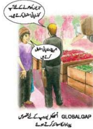
GLOBAL GAP اسٹیکر ایڈمپ کے لئے ضروری ہے اور اس کا سامنا کرتے ہوئے

عمدہ زراعتی طریق کار (GAP) کو ذمہ معیارات اور قوانین وضواید سے مراد وہ ضوابط ہیں جو کاشتکاروں میں غذائی اطمینان، پیداوار، تیار کرنے والی حکمت عملی، کثافت اور غیر سرکاری تنظیمیں (NGOs) کی جانب سے ترقی پاتے ہوئے ہیں جن کا مقصد زراعتی طریق کار کو بہت ساری اشیاء تجارت کے لئے کاشتکاری کی سطح پر باقاعدگی میں ترمیم دینا ہے۔