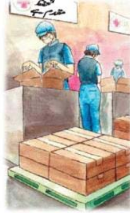
کام کاج کے لئے کامیاب اور محفوظ ماحول۔

SA8000 سرٹیفیکیشن بین الاقوامی مزدور حقوق کے لئے ایک بہت ہی تفصیلی کھتی برائے معیارات ہے۔ یہ ابتدا میں بڑے بڑے زرعی متن کی کمپنیوں کے لئے مفید ہوتی ہے جہاں سے اپنے کارپوریٹ عوامی تعلقات کے سلسلے میں استعمال کرتی ہیں۔ SA8000 معیار زرخیزی اور روایت کو فروغ دینے میں معاون ہو سکتا ہے اسی طرح مزدور فراہم کرنے اور انہیں کام پر لگانے رکھنے میں بھی معاون ہو سکتا ہے۔ اگرچہ دوسری اظہر میں یہ بات بہت عام ہے کہ زراعتی اظہر نے SA8000 کی طرف توجہ بہت کم دی ہے کیونکہ سوئی پیداوار میں اسکول میں لاہا مشکل ہوتا ہے۔