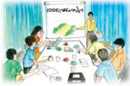
کسان اور مداحین اہل تصدیق نمن طریقہ ہیں۔

اس بات کی تصدیق کرنے کے لئے کہ معیار کی تکمیل کی گئی ہے، نمن طریقہ ہے۔ پہلے طریقہ میں کچھ معیار منتخب کرنے اور اپنے چند لازمی اہم ترین کو تسلیم کرنے کا فیصلہ کر سکتی ہے اس بات کی تصدیق کرنے کے لئے کہ اس کے سارے شعبے اس کے موافق ہیں۔ اسے پہلی ویرینٹیشن پارٹی کہا جاتا ہے۔ دوسرے طریقہ میں کچھ معیار منتخب کر سکتی ہے کہ اس کے سلاٹرز معیار سے ہم آہنگ ہوں اور اس پر قائم رہیں تاکہ وہ ایسا کر سکیں۔ یہ دوسری ویرینٹیشن پارٹی ہے۔ غری طریقہ یہ ہے کہ کچھ معیار منتخب کر سکتی ہے کہ اس کے سلاٹرز معیار کے موافق ہوں، اور کسی آزاد تنظیم سے جو تجارتی تعلقات میں شامل نہیں ہے یہ درخواست کر سکتی ہے کہ وہ اس بات کی گھرائی کرے کہ اس کے سلاٹرز قانون کی پاسداری کریں۔ اسے تیسری ویرینٹیشن پارٹی کہا جاتا ہے۔ اور اسے سرٹیفیکیشن کا نام بھی دیا جاتا ہے۔ اس لئے اسی وضاحت کے پیش نظر تصدیق کا عمل ہمیشہ آزاد تیسرے فریق کے ذریعہ ہونا چاہئے۔ معیار کے طور پر اس تنظیم کو جس نے معیار قائم کئے ہیں تصدیق کے عمل کو خود سے انجام نہیں دینا چاہئے۔ بلکہ اسے چاہئے کہ ایسے تصدیق کنندوں کا اختیار دے جو اہل اور آزاد ہوں۔ اور جو اس کام کو ان کی قابلیت اور صلاحیت کو جانچ کر انجام دے۔