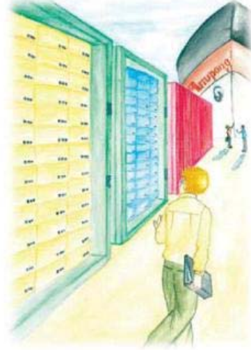
مقامی یا غیر درآدہ شدہ اشیاء کی تکثیف کرتے ہوئے۔

پودا کاری کے قوانین و ضوابط کے ساتھ چلنا ہوگا تاکہ بے مقاصد تک جان کنیزے کوڑے اور پودے کی بیماریاں بچنے اور سرایت کرنے نہ پائے۔ دنیا بھر کے پودے درآدہ کرنے والے لیماس تک کیڑے کوڑے کے خطرہ کا تجربہ کرتے ہیں درآدہ شدہ پودا کے خطرے کی سطح و معیار کی تبدیلی اور پودا کی آمد کے وقت تکثیف کرنے کی غرض سے تاکہ یہ یقین ہو جائے کہ خطرے کی سطح و معیار حد سے تجاوز نہیں ہے۔