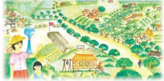
نامیاتی پیداوار پر توجہ دینے والے قوم کے اندر ماحولیاتی توازن۔

نامیاتی زراعت پیداوار کا ایک طریقہ ہے جو کھیتی باڑی اور اس کے ماحول کو ایک ہی نظام کے طور پر انتظام کرتا ہے۔ یہ سائنسی اور درجی دونوں علوم کا استعمال زرعی تصدیق کے ماحول کو بہتر بنانے کے لئے کرتا ہے جس پر کھیتی باڑی منحصر ہوتی ہے۔ نامیاتی کھیتی باڑی مقامی قدرتی وسائل اور تصدیق کے انتظام پر مشرف ہوتی ہے، تاکہ خاموشی زراعتی زراعت پر جیسا کہ غیر نامیاتی، مصنوعی کھادیں۔ اس لئے نامیاتی زراعت مصنوعی کھاد اور کیمیائی طور پر ترمیم شدہ ذرائع کو نقل نہیں کرتی ہے۔ یہ صحیح پسنداندہ روایتی کھیتی باڑی کے طریق کار کو بحال دیتی ہے جو زمین کی زرخیزی کو برقرار رکھتے ہیں جیسے غیر مردہ مادی۔