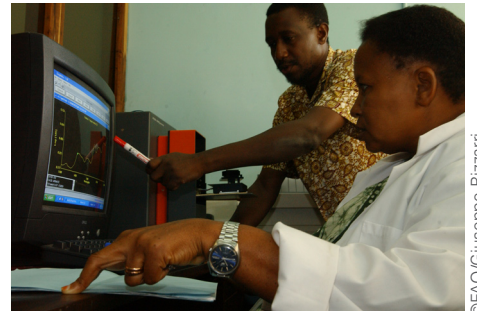
坦桑尼亚科学家为粮农组织支持的研究项目开展试验。

要使国家能力得到加强，作为个人必须掌握更多的知识、能力和技能。因此，寻求实现其发展目标的任何国家所要具备的根本条件是提供适当的环境，以所有三个方面为重点，综合开展长期可持续的活动。