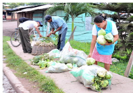
粮农组织在尼加拉瓜执行的项目帮助小农提高生产力。