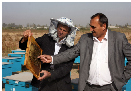
塔吉克斯坦的养蜂业受益于粮农组织实施的一个改善家畜卫生项目。