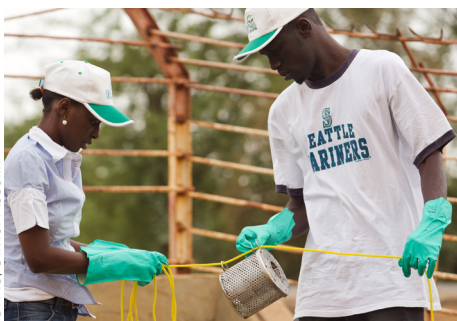
塞内加尔技术人员为检测农药残留量做准备工作。