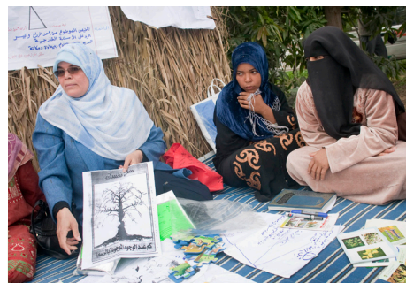
培训教员与埃及种植草莓的农民在农民田间学校。