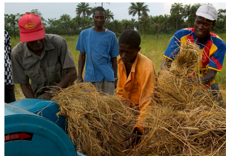
粮农组织帮助塞拉里昂政府开展农民培训。

署了49项南南合作协议，派遣了1500余名专家和技术人员。粮农组织目前正在力争与若干国家结成南南合作战略联盟。最近的一个例子是与中国签署的一项价值3000万美元的信托基金，向在数个东道国开展的南南合作提供支持。