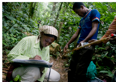
对妇女和男人进行林业培训。