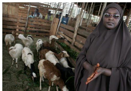
布隆迪妇女从TeleFood项目中领到羊。

TeleFood的资金主要来自私人捐款和企业赞助。自1997年启动以来，TeleFood通过数十次音乐会、体育赛事、电视节目和其他活动，为消除饥饿项目筹集资金。对TeleFood的支持形式多样。直接财政捐款和（技术或其他）援助使得组织广播节目、音乐会和体育赛事成为可能。来自世界各地的知名人士在筹资活动上献艺或利用他们的名字开展宣传。自TeleFood项目启动以来，已经筹集到2900多万美元的捐款。