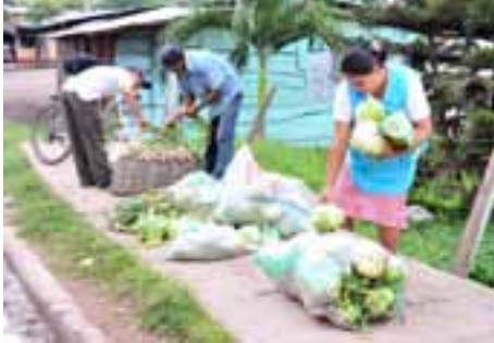
مشروع للمنظمة في نيكاراغوا يساعد صغار المزارعين في زيادة إنتاجيتهم.