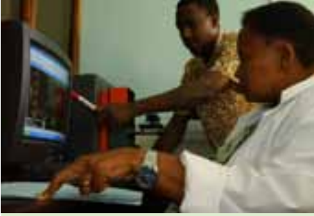
باحثون تنزانيون يجرون فحوصاً في إطار مشروع بحوث تدعمه المنظمة.