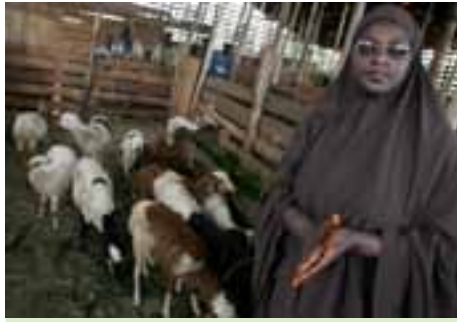
هذه المرأة البوروندية تلقت رأس ضأن من برنامج تليفود.

يرتكز تمويل برنامج تليفود في الأساس على تبرعات الأفراد والرعاية التي تقدمها الشركات. وقد استخدم البرنامج منذ انطلاقة عام 1997 عشرات الحفلات الموسيقية والفعاليات الرياضية والبرامج التلفزيونية والفعاليات الأخرى المكرسة لجمع التبرعات من أجل تمويل مشروعات تهدف إلى محاربة الجوع. ويتلقى البرنامج أنواعاً مختلفة من الدعم منها المساهمات المالية المباشرة، ومنها المساعدات التطوعية سواء كانت تقنية أو غيرها، ما يساعد في تنظيم فعالياته. كما يشارك مشاهير من كافة أنحاء العالم في فعاليات جمع التبرعات أو يسخرون أسماءهم لخدمة هذه القضية. وقد جمع تليفود منذ أن بدأ نشاطه تبرعات زادت قيمتها على 29 مليون دولار أمريكي.