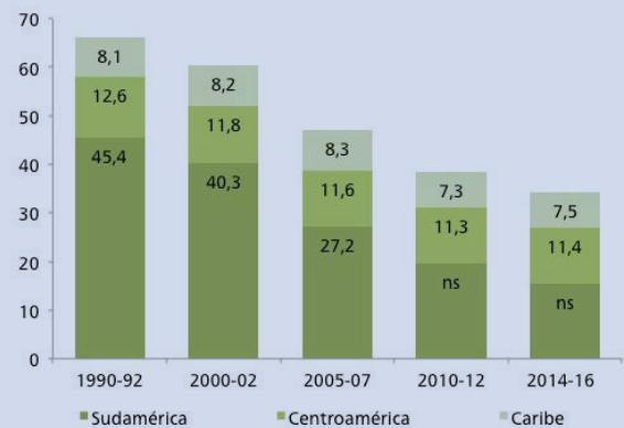
Gráfico 1. Evolución del hambre en la Región por millones de personas y por prevalencia (SOFI, 2015)

Por otro lado, todos los países de América del Sur tienen tasas de obesidad que sobrepasan los respectivos índices de prevalencia de hambre los que conllevan serios problemas de salud pública (índice de obesidad mundial 11.7%, índice de obesidad subregional 21.6%). Paradójicamente todos los países muestran problemas de acceso a alimentos por parte de algunos grupos vulnerables que son el resultado de las desigualdades socio-económicas existentes.