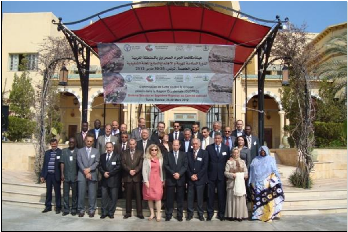
المشاركون في الدورة السادسة لهيئة مكافحة الجراد الصحراوي في المنطقة الغربية تونس العاصمة، تونس، 26-30 مارس 2012