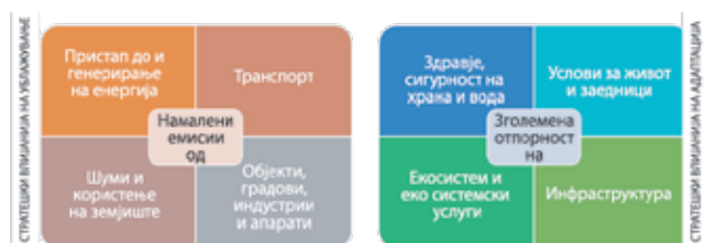
Стратешки инвестициски области на ЗКФ

Проектите претенденти за финансирање преку ЗКФ мора да имаат влијание преку намалени емисии (ублажување) и зголемена отпорност кон климатските промени (адаптација) во барем еден од националните приоритетни сектори за климатска акција, и истовремено да се усогласени со стратешките инвестициските области на ЗКФ, како што е прикажано на сликата подолу: