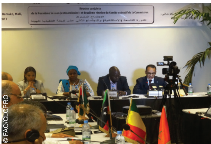
Cérémonie d'ouverture de la session extraordinaire