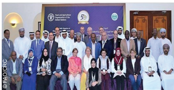
Participants à la 30ème session de la Commission de lutte contre le Criquet pèlerin dans la région Centrale et à la 34ème réunion de son Comité exécutif

• 30ème session de la CRC tenue du 18 au 25 février, Mascate, Oman.