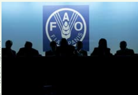
Sala principal de reuniones de la FAO.

La FAO fue objeto de una completa evaluación externa e independiente en 2005 que condujo a la adopción por sus países miembros de un “Plan inmediato de acción para la renovación de la FAO”. Este plan de acción quinquenal –abarca el período de 2009 a 2013– tiene como objetivo crear una Organización más ágil, eficaz y orientada a los resultados. La renovación comprende: