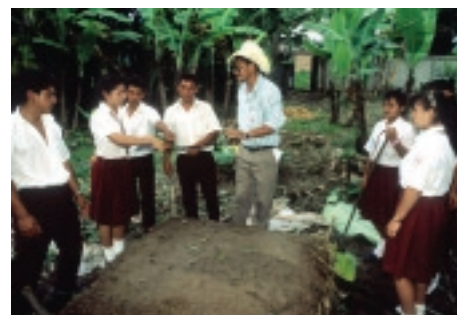
Школьный огород в Центральной Америке.

Источник: Институт статистики ЮНЕСКО/ЮНИСЕФ, 2005 год, адаптация графика с сайта: http://www.fao.org/erp/erp-activities-en/erp-2006/e2006-8/en/