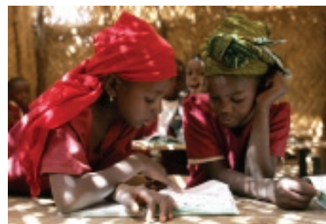
Дети в начальной школе в Западной Африке.