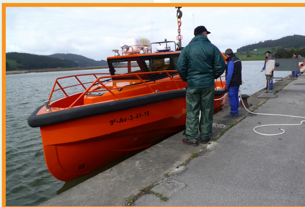
The jet-propelled workboat launched on 9 March 2016 Le bateau de travail à propulsion lancée le 9 mars 2016