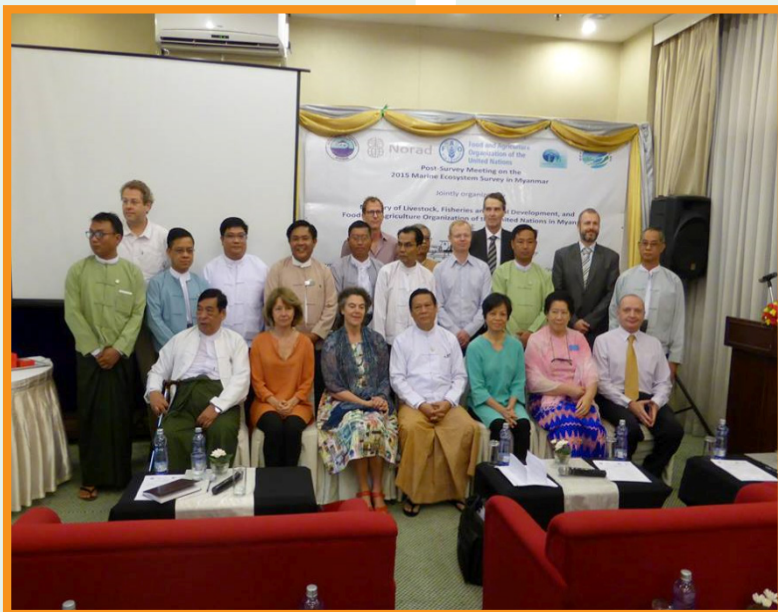
Post survey meeting participants Participants à la réunion post-campagne

As a follow-up to this activity, the EAF-Nansen Project has been requested to organise in 2016 a workshop survey data analysis and one on species identification.