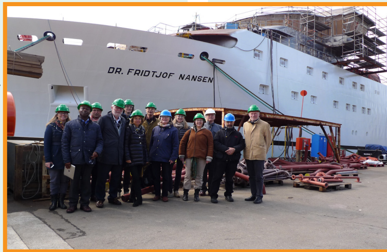
Norad, FAO and IMR staff during the visit to the Shipyard at Castropol, Spain Le personnel Norad, FAO et IMR au cours de la visite au chantier naval à Castropol, Espagne

The first quarter of 2016 saw major activities in the EAF-Nansen Project. In this issue of the e-Approach we would like to share with you news from some of the activities involving research, management and capacity development. Under the component involving the use of the research vessel Dr Fridtjof Nansen , two important post-survey meetings were held one of which saw the participation of a sector Minister and a Norwegian Ambassador. That event offered an excellent opportunity to demonstrate the direct and immediate link between research vessel surveys, policy and management of fishery resources. Related to this is the initiative to document and showcase the scientific contribution that the Nansen surveys have made over the years in the western Indian Ocean area (east coast of Africa). Under the policy and management component of the project, the Republic of Congo and the Democratic Republic of the Congo joined the cluster of countries in eastern part of the Gulf of Guinea that have been working together for a better management of the shrimp resources in the area. The Focal points of the EAF-Nansen Project in Cameroon and Gabon have been assisting the two countries. Clearly, these activities have brought the EAF-Nansen Project into the limelight as this phase of the project gradually comes to an end.