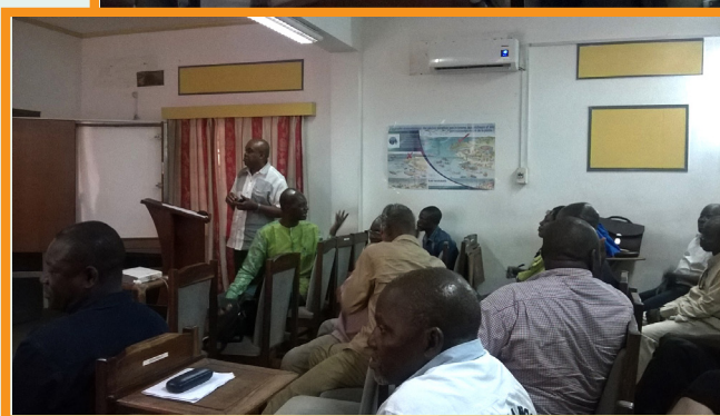
Discussions during the ERA Workshop. Discussions durant l'atelier ERE.