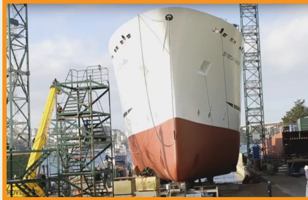
Preparation of the launch of the new vessel at the Astilleros Gondan Shipyard, Spain Préparation du lancement du nouveau navire au chantier naval Astilleros Gondan, Espagne

On the occasion of the 10th Norad/FAO/IMR Annual Meeting on the EAF-Nansen Project, representatives of the three institutions visited the vessel to see the progress of work. The officers expressed their satisfaction for the work done. According to information obtained from the shipyard, on each day about 85 workers are put to work on the ship, each working for about 10 hours. The vessel will operate with a jet-propelled workboat that will facilitate work in shallow waters. The workboat was launched on 9 March 2016 witnessed by the Norad/FAO/IMR team.