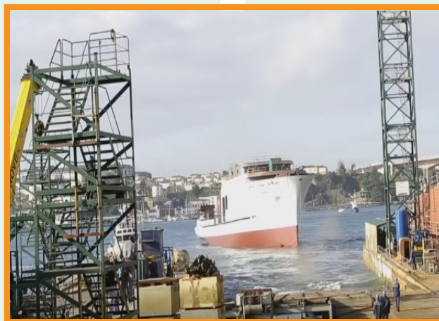
The new R/V Dr Fridtjof Nansen is in the water Le nouveau N/R Dr Fridtjof Nansen est à l'eau