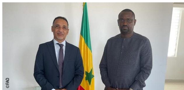
Le Secrétaire Exécutif de la CLCPRO avec le Ministre de l'Agriculture, de l'Équipement Rural et de la Souveraineté Alimentaire du Sénégal, Dakar (Sénégal)

Le Secrétaire Exécutif de la CLCPRO a rendu visite le 04 décembre 2023 à son excellence Monsieur Samba Ndiobene Ka, Ministre de l'Agriculture, de l'Équipement Rural et de la Souveraineté Alimentaire de la République du Sénégal.