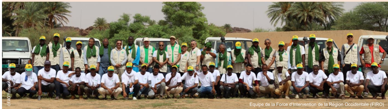
Equipe de la Force d'Intervention de la Région Occidentale (FIRO)