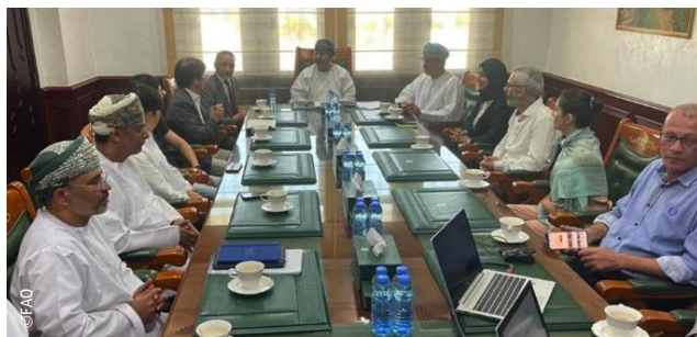
4 e Essai de Drones dans la Surveillance des Biotopes du Criquet Pèlerin, Muscat (Oman)

Dans le cadre des efforts de collaboration continus pour développer de nouveaux outils technologiques à introduire dans le système d'alerte précoce contre le Criquet pèlerin, les Commissions FAO pour la lutte contre la Criquet pèlerin dans les Régions Occidentale (CLCPRO) et Centrale (CRC) en collaboration avec le siège de la FAO, ont organisé un essai d'utilisation de drones de surveillance à Oman du 5 au 9 février 2023.