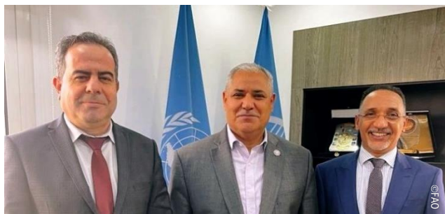
Le Secrétaire Exécutif et le Président de la CLCPRO avec le Sous-Directeur Général de la FAO