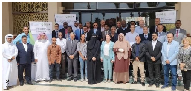
Atelier de Formation Interrégional des Chargés de l'Information de l'Information Acridienne.

L'objectif principal était d'optimiser ces outils dans leur travail quotidien et de proposer de nouvelles solutions pour l'avenir.