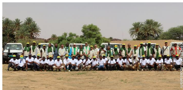
Equipes de la Force d'Intervention de la Région Occidentale

Les neuf équipes de surveillance ont parcouru la bande sahélienne ( Trarza, Brakna, Gorgol, Guidimagha, Assaba, Hodh El Chargui et Hodh El Gharbi ), se soldant par la prospection d'une superficie totale de 91 179 hectares, dont 89 559 hectares par voie terrestre et 1 620 hectares par voie aérienne. La distance totale parcourue au cours de cette opération s'élève à 61 511 kilomètres.