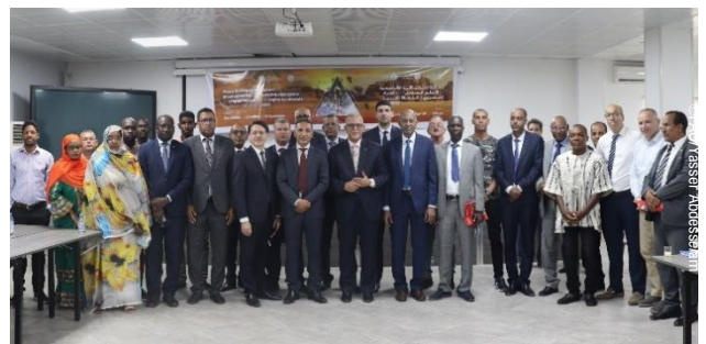
Réunion de Lancement du Plan d'Anticipation Régional pour la Prévention du Développement Possible d'une Résurgence Acridienne en Région Occidentale

Eu égard à l'évolution de la situation acridienne au Maroc, en Algérie et en Mauritanie durant le premier semestre de l'année 2023, caractérisée par la présence en Algérie et en Mauritanie, de groupes d'ailés de Criquets pèlerins transiens et la poursuite des opérations de lutte contre les groupes issus de la reproduction printanière au Maroc, la CLCPRO, dans sa stratégie d'anticipation, avait inséré dans l'ordre du jour de l'atelier d'élaboration du cinquième plan de formation régional (PFR V: 2023-2026), une session dédiée à la discussion de la situation acridienne et les dispositions à prendre, en concertation avec les responsables des unités nationales de lutte antiacridienne des pays membres.