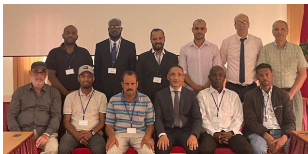
Atelier de Maintenance des Equipements de Traitement à Ultra-Bas Volume, Agadir (Maroc)

Cette initiative, financée par le fonds du projet AFD, revêt une importance cruciale dans le renforcement des politiques et des capacités régionales, contribuant ainsi à des mesures de lutte plus efficaces et durables, notamment en termes de préparation pour les urgences nécessitant un matériel de pulvérisation conforme aux normes d'usage.