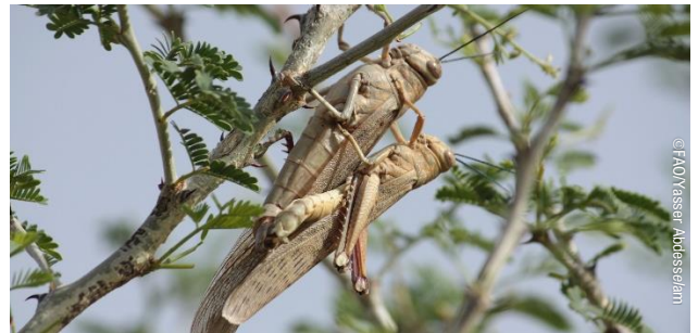
Un couple de Criquets arboricoles ( Anacridium melanorhodon ), Tintane (Mauritanie).

Les conditions météorologiques ont été caractérisées par des pluies faibles durant la saison printanière et un début de pluies pré-estivales à la fin de la troisième décennie du mois de mai, avec des variations de la position du Front Intertropical (FIT) entre 150 km au Sud et 190 km au Nord de la normale, en Mauritanie, et entre 100 km et 190 km au nord de la normale, au Tchad, jusqu'au mois d'octobre, à la fin de la saison estivale.