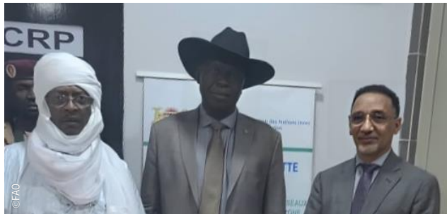
Le Secrétaire Exécutif de la CLCPRO avec Le ministre d'état, ministre de la Transformation Agricole du Tchad et le Directeur Général de l'Agence Nationale de Lutte Antiacridienne (ANLA)