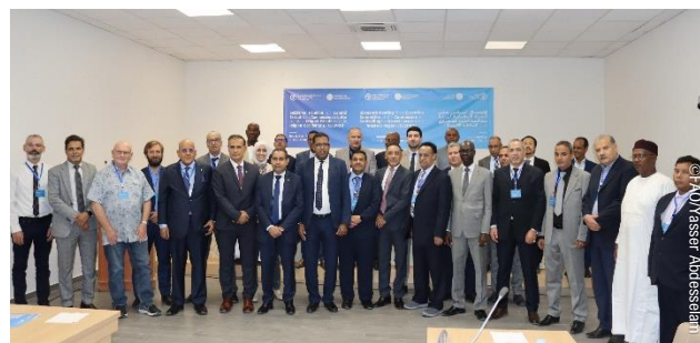
Ouverture de la 16 e réunion du comité exécutif de la CLCPRO, Nouakchott (Mauritanie).

Le Secrétariat Exécutif de la CLCPRO a organisé la seizième réunion de son Comité exécutif, du 11 au 15 décembre 2023, à Nouakchott (Mauritanie). Cette réunion, a réuni les pays membres constituant le comité exécutif (Algérie, Burkina Faso, Sénégal, Tchad et Tunisie) ainsi que des partenaires techniques et des experts internationaux.