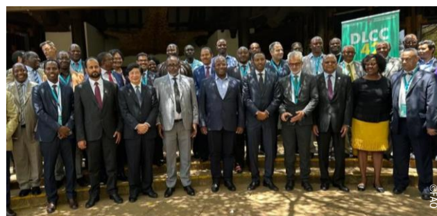
42 e Session du Comité de Lutte contre le Criquet Pèlerin, Nairobi (Kenya)

La Commission de Lutte Contre le Criquet Pèlerin dans la Région Ouest (CLCPRO) a joué un rôle actif et significatif lors de la 42 e Session du Comité FAO de Lutte Contre le Criquet pèlerin (DLCC), tenue à Nairobi (Kenya) du 13 au 17 Mars 2023.