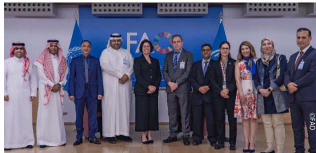
Représentants des Commissions de Lutte contre le Criquet Pèlerin dans les Régions Occidentale (CLCPRO) et Centrale (CRC) au siège de la FAO, Rome (Italie).

Les responsables ont également abordé les défis actuels de la lutte contre le criquet pèlerin dans la région.