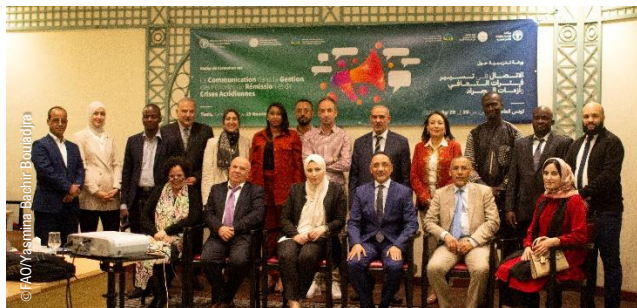
Atelier de formation sur la Communication dans la Gestion des périodes de rémission et de crises acridienne, Tunis (Tunisie)

La Commission de Lutte Contre le Criquet Pèlerin dans la Région Occidentale (CLCPRO) a organisé un atelier de formation en communication à Tunis, du 20 au 25 novembre 2023.