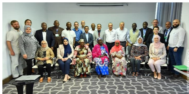
Atelier d'Elaboration du Cinquième Plan de Formation Régional PFR V (2023-2026), Oran, Algérie.

Cet événement a rassemblé les Directeurs généraux des unités nationales de lutte antiacridienne des dix pays membres de la CLCPRO, ainsi que les « points focaux formation » des pays de la ligne de front, à savoir le Mali, la Mauritanie, le Niger et le Tchad.