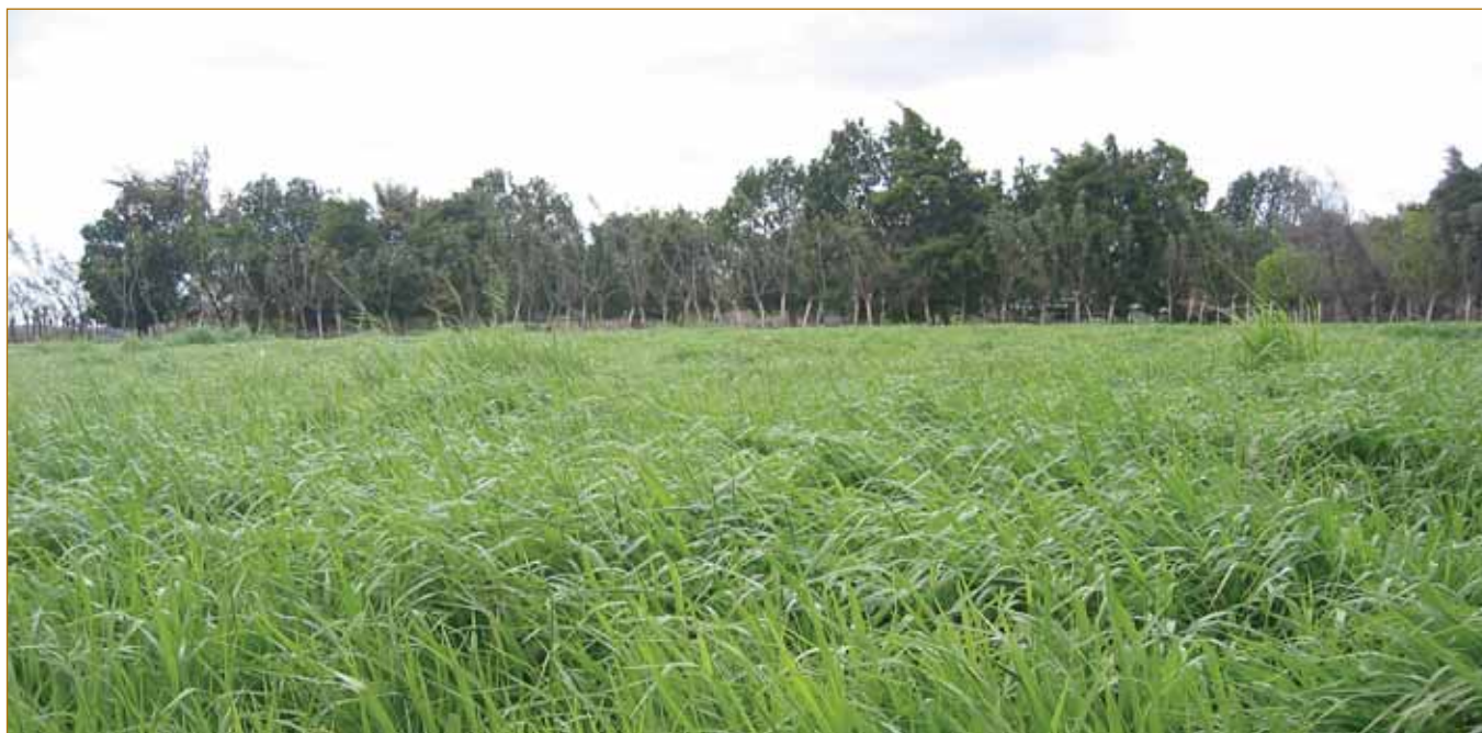
Pastura mejorada en una finca intensificada en Río Frío, Costa Rica (proyecto FRAGMENT 2003).