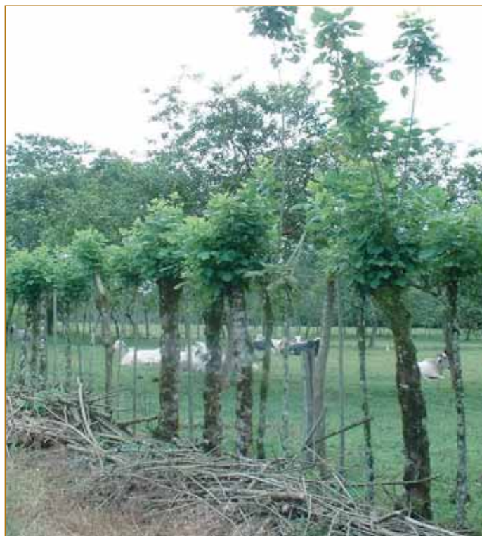
Cerca viva en una finca de Río Frío, Costa Rica (proyecto FRAGMENT 2003).

El nivel de intensificación en las fincas ganaderas influye en el área de bosques, en la densidad y el manejo de las cercas vivas y en la densidad de árboles en potreros. El área de bosques fue menor en las fincas intensivas que en las de baja intensificación (Cuadro 2), posiblemente porque las primeras manejan cargas animales altas y mayor número de apartos para el establecimiento de pastos mejorados, que obligan a los productores a reemplazar algunas áreas de bosque por pasturas. Además, las fincas de alta intensificación no presentaron charrales, plantaciones forestales y huertos frutales, ya que son sistemas especializados cuyo principal ingreso es la producción de leche. El tamaño pequeño de estas fincas intensificadas también hace que los productores