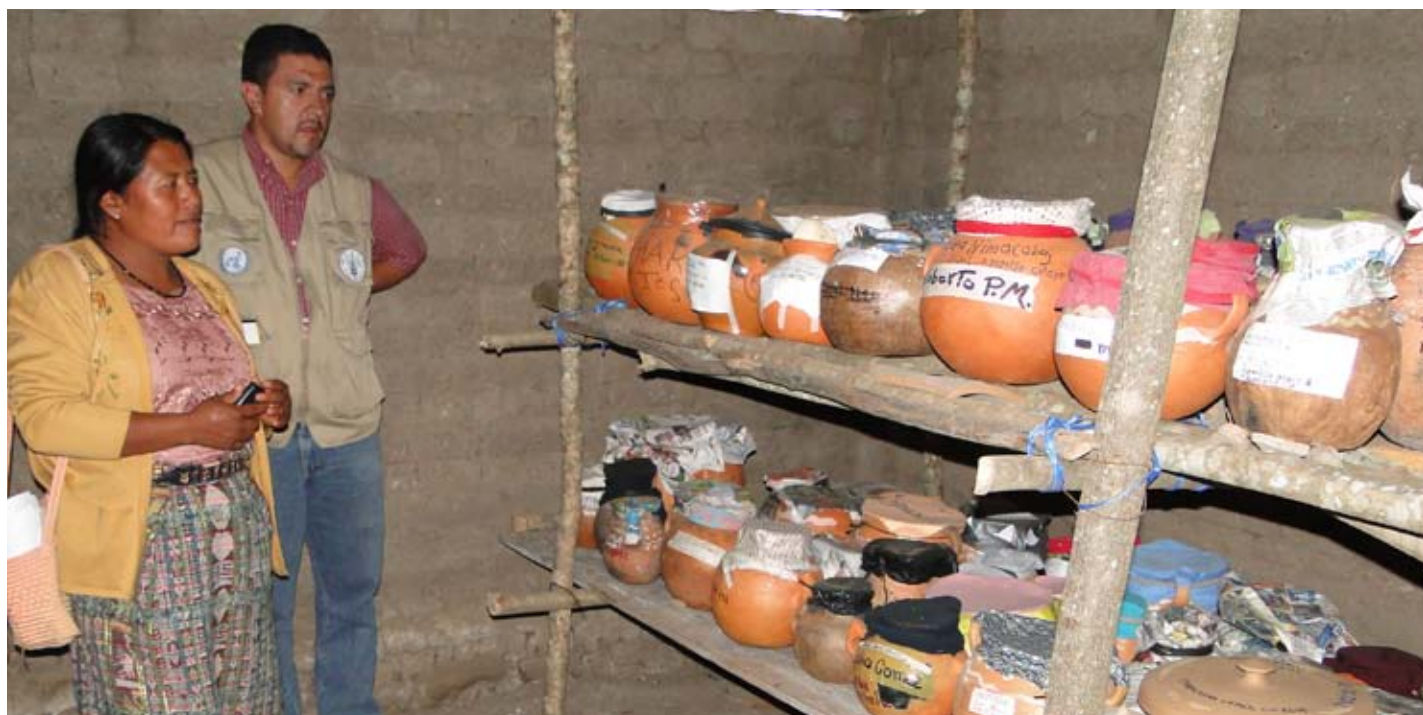
Banco Comunal de Reserva de semilla en la Comunidad Las Vegas, Rabinal. B.V