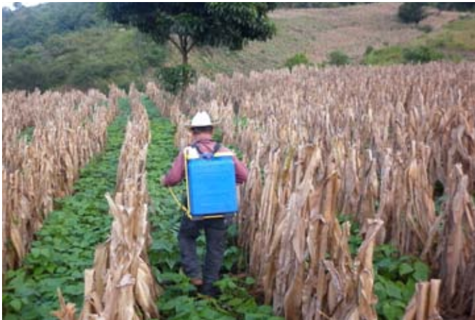
Las prácticas inocuas en la producción agrícola contribuyen a la calidad del producto y son necesarias para el establecimiento de negocios.

El proyecto Agrocadenas contribuye a mejorar la seguridad alimentaria de las familias mediante el fortalecimiento de la pequeña agricultura empresarial con la aplicación de buenas prácticas agrícolas, de manufactura y empresariales en los cultivos de frijol y papa en Guatemala.