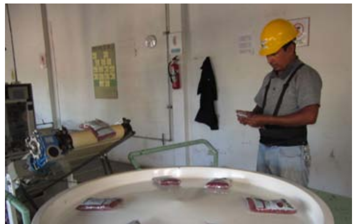
El valor agregado al producto permite mejorar el precio y asociado a los procesos de mercadeo contribuye mejorar las ventas.