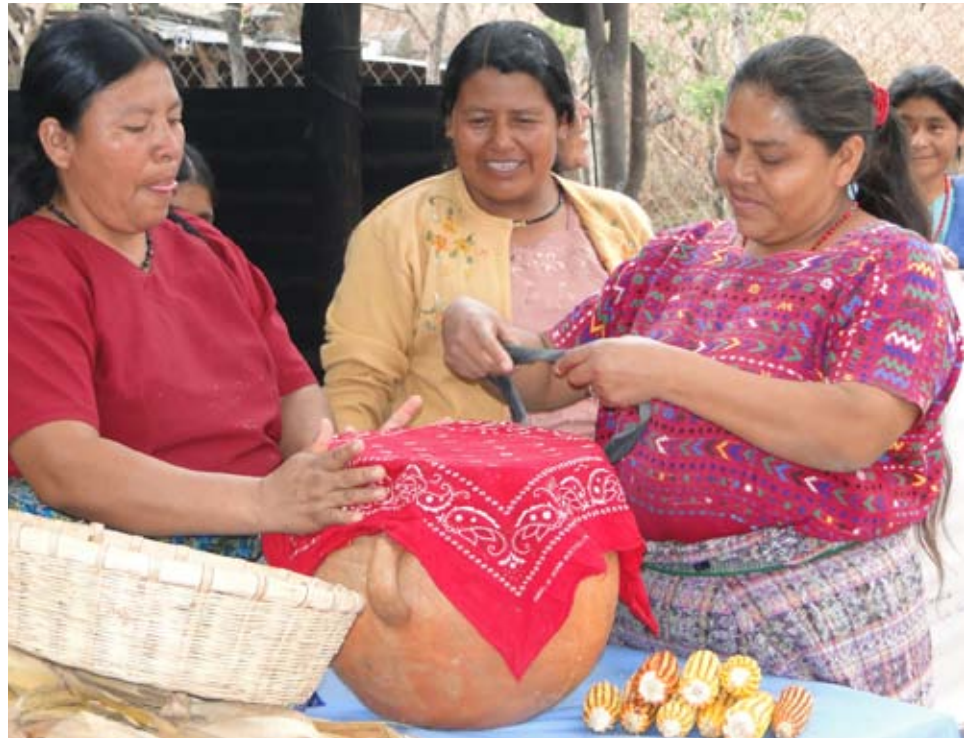
Familias desarrollan proceso de almacenamiento de semillas.

En el año 2012, como parte del proceso de mejoramiento de la semilla y reducción de riesgo ante cualquier fenómeno, se acompañó a las familias con la implementación de los bancos comunales de semillas criollas.