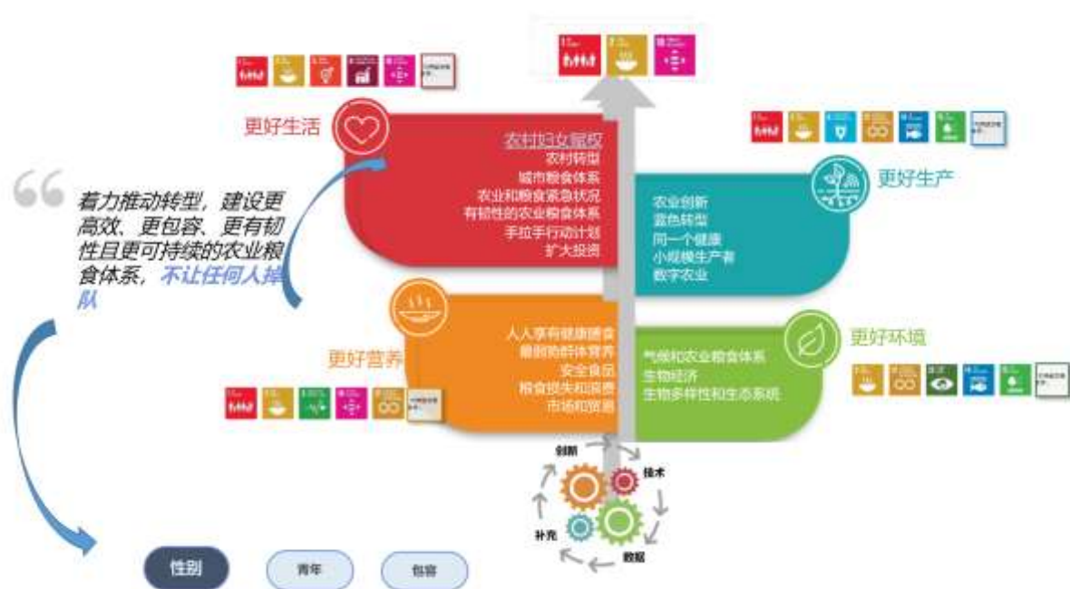
图 1：性别工作在《战略框架》中作为一项单独的计划重点领域和一项跨领域主题

8. 已确定 20 项计划重点领域，以指导粮农组织应对关键短板，并创造条件促进变革，最终推动实现相关可持续发展目标具体目标。性别工作在《2022-31 年战略框架》中发挥着关键作用，也是聚焦“性别平等和农村妇女赋权”（更好生活之一）的计划重点领域之一，因此重点关注可持续发展目标 5 的具体目标，并提出对应的成果声明 5 。