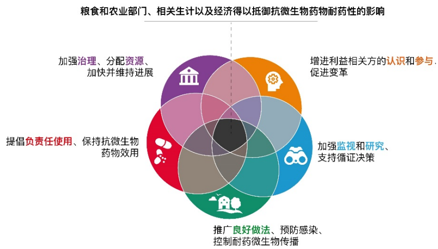
图 1 有效防控抗微生物药物耐药性需要各国协调努力，以实现所有五项目标。为药物研发争取更多时间，并尽可能长时间地保持抗微生物药物效力，这取决于抗微生物药物负责任使用的多部门举措，以及更好地降低感染风险和治理需求的做法。这些举措的成功取决于善治、实证和监测以及有效宣传和行为改变计划。