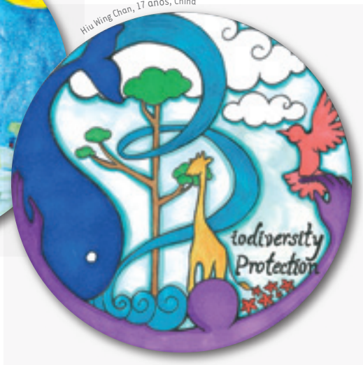
Hui Wing Chan, 17 años, China