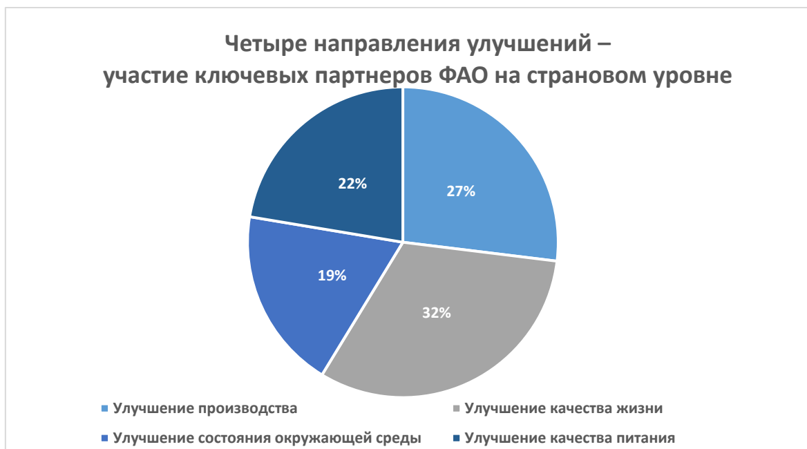
Рисунок 3. Основные партнеры – участники системы ООН в разбивке по четырем направлениям улучшений

Партнерские отношения ФАО с участниками системы ООН сбалансированы по всем четырем направлениям улучшений. Данные внутреннего обследования на страновом уровне, проведенного ФАО в марте 2022 года.