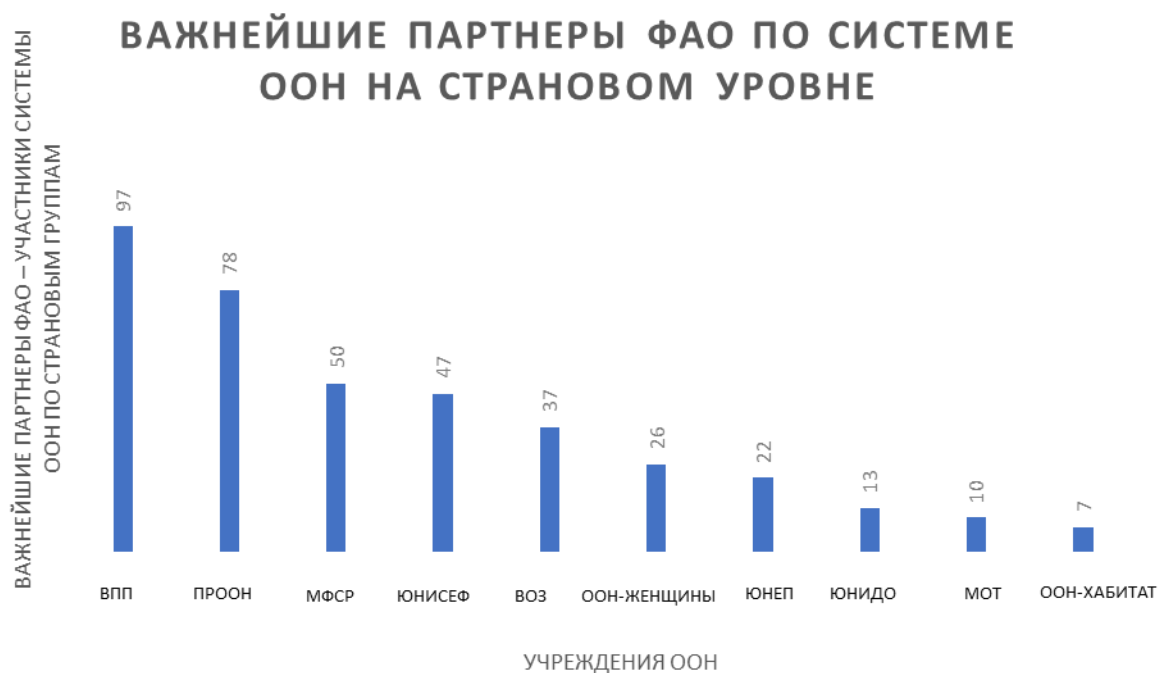
Рисунок 2. Важнейшие партнеры ФАО по системе ООН на страновом уровне

Данные на март 2023 года, источник – обзор ежегодных страновых докладов ФАО. Каждому страновому представительству ФАО было предложено указать и расставить в порядке значимости до трех партнеров по системе ООН в стране, указав соответствующие цифры с учетом как формальных, так и неформальных партнерских договоренностей.