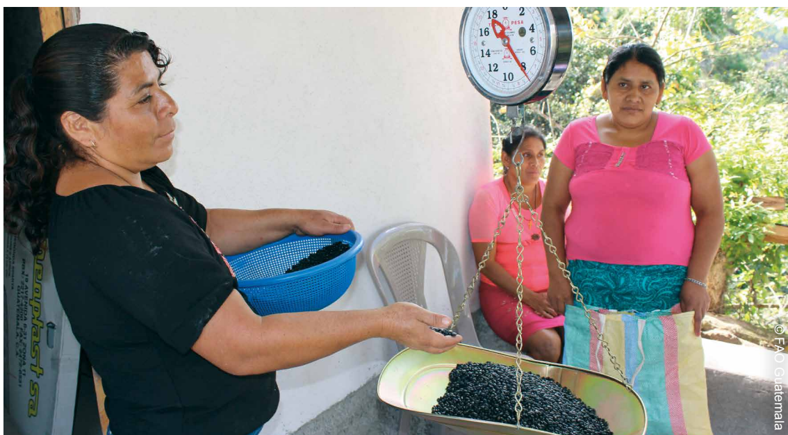
Mujeres pesando granos básicos en el Corredor Seco de Guatemala. La FAO apoyó con insumos agrícolas (semillas) y asistencia técnica sobre el almacenamiento de los granos para períodos de escasez. La actividad es parte del proyecto Sistema de restauración de alimentos y fortalecimiento de la resiliencia de las familias afectadas por la sequía del 2014 en Chiquimula y Jalapa, Guatemala.

Para facilitar la asistencia de mujeres con niñas y niños pequeños a las sesiones de capacitación, el proyecto introdujo el “cuidado móvil de infantes”: así las personas participantes se turnaban para cuidar a las y los niños para que las demás mujeres pudieran prestar toda su atención (FAO, 2015b). Resultó muy económico, requiriendo solo el suficiente número de juguetes. El personal del proyecto informó también que durante la capacitación técnica, que involucró tanto mujeres como hombres, se ha fomentado satisfactoriamente las “masculinidades positivas”, lo que dio a los hombres la oportunidad de apreciar la participación de las mujeres como sus iguales.