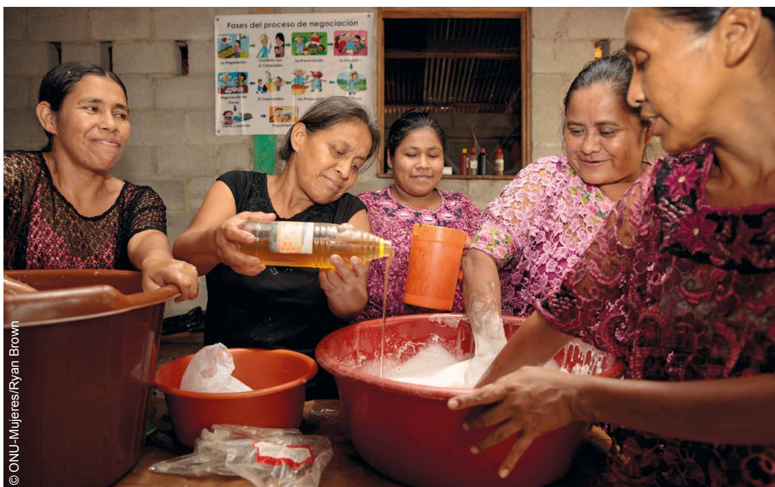
Mujeres de Aldea Campur, en Alta Verapaz, que aprendieron a producir y vender champú en los mercados locales gracias al apoyo del Programa conjunto para acelerar el progreso hacia el empoderamiento económico de las mujeres rurales (JP RWEE).

En Guatemala, el programa se centró en un área donde las necesidades son altas. El Valle de Polochic representa una de las regiones más pobres de Guatemala y es un área crítica para trabajar por la igualdad de género y los derechos de las mujeres. Los municipios en los que se centró el JP RWEE son 89% indígena, y la tasa de pobreza es significativamente más alta que el promedio nacional. Al momento del diseño del programa, la tasa de pobreza era del 85% en el Valle de Polochic, en comparación con la tasa promedio nacional de 59,3%, y la participación económica relativa de las mujeres era menor que el promedio nacional (JP RWEE, 2021a).