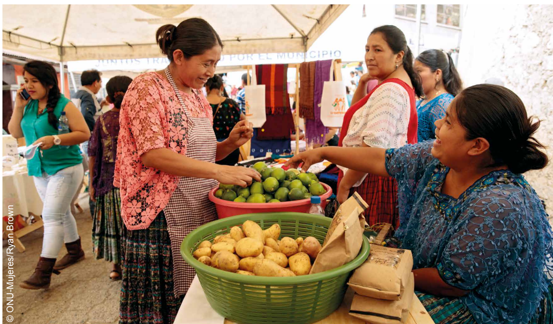
Mujeres vendiendo sus productos en un mercado municipal de Tucuru, en Alta Verapaz.

A pesar de que la mortalidad materna se ha reducido casi a la mitad, de 205 muertes maternas por 100 000 nacidas y nacidos vivos en 1990 a 95 por 100 000 en 2017, sigue siendo una de las más altas de la región (Banco Mundial, 2022b). La violencia de género y el feminicidio continúan siendo un problema importante y Guatemala se clasifica entre los países con la tasa más alta de muertes violentas de mujeres (9,7 de 100 000) (ONU-Mujeres, 2022). Las mujeres y las niñas mayores de 15 años dedican el 20,6% de su tiempo al trabajo doméstico y de cuidados no remunerado, en comparación con el 2,1% que dedican los hombres (ONU-Mujeres, 2022). Con respecto a la representación política, solo el 19% de los escaños en el parlamento nacional estaban ocupados por mujeres en 2021 (Banco Mundial, 2022c).