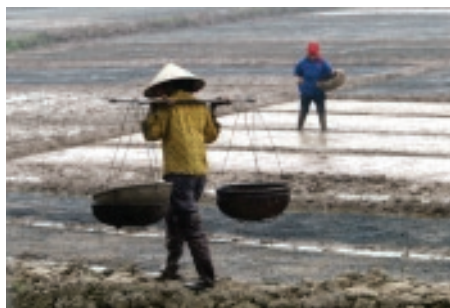
Работа на рисовых плантациях.

Подробная информация о гендерных вопросах на веб-сайте ФАО: http://www.fao.org/gender