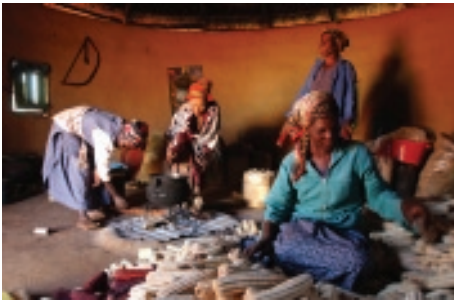
Сортировка кукурузных семян.

В целях поощрения гендерного равенства – положения, когда все люди имеют равные права, возможности и вознаграждение независимо от того, рождены ли они женщинами или мужчинами, – а также расширения прав и возможностей женщин, ФАО работает в трех основных направлениях: