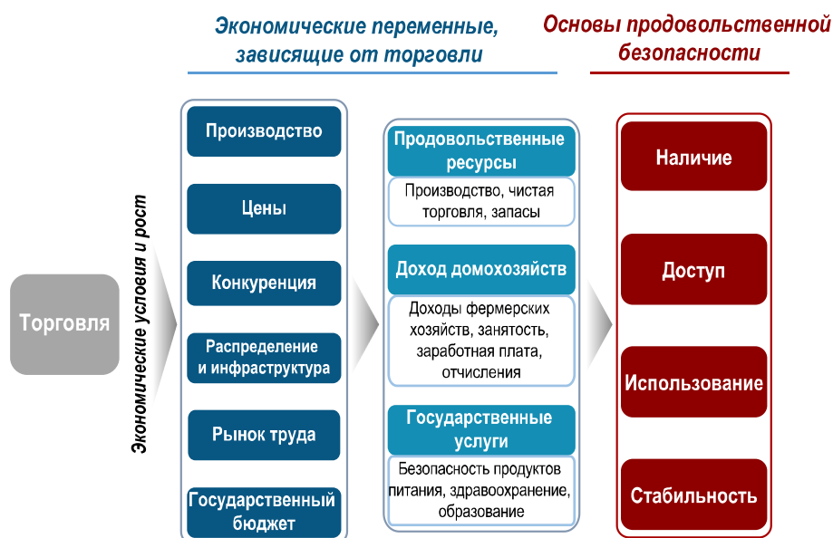
Рис. 2. Торговля и четыре основы продовольственной безопасности: каналы взаимодействия

10. Ряд глубинных факторов влияет на путь взаимодействия торговли и продовольственной безопасности, в конечном счете определяя положительный или отрицательный характер влияния. В числе этих факторов: функционирование внутренних рынков продовольствия; способность и готовность производителей реагировать на изменяющиеся стимулы; участие мелких фермеров в рыночных отношениях. При разработке мер вмешательства в области торговой политики необходимо принимать во внимание различные глубинные факторы, которые влияют на связи между торговлей и продовольственной безопасностью.