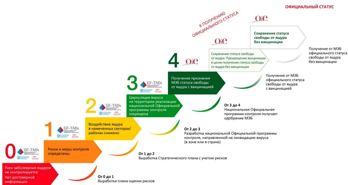
Рисунок 1. Прохождение этапов при осуществлении Плана поэтапной борьбы

обеспечения предметной поддержки РКГ в ее оценке статуса стран в рамках ГМ-ТБЖ. Результаты этого процесса находятся в открытом доступе и будут опубликованы на веб-сайте ГМ-ТБЖ. Однако исходные данные не будут распространяться без согласия соответствующей страны.