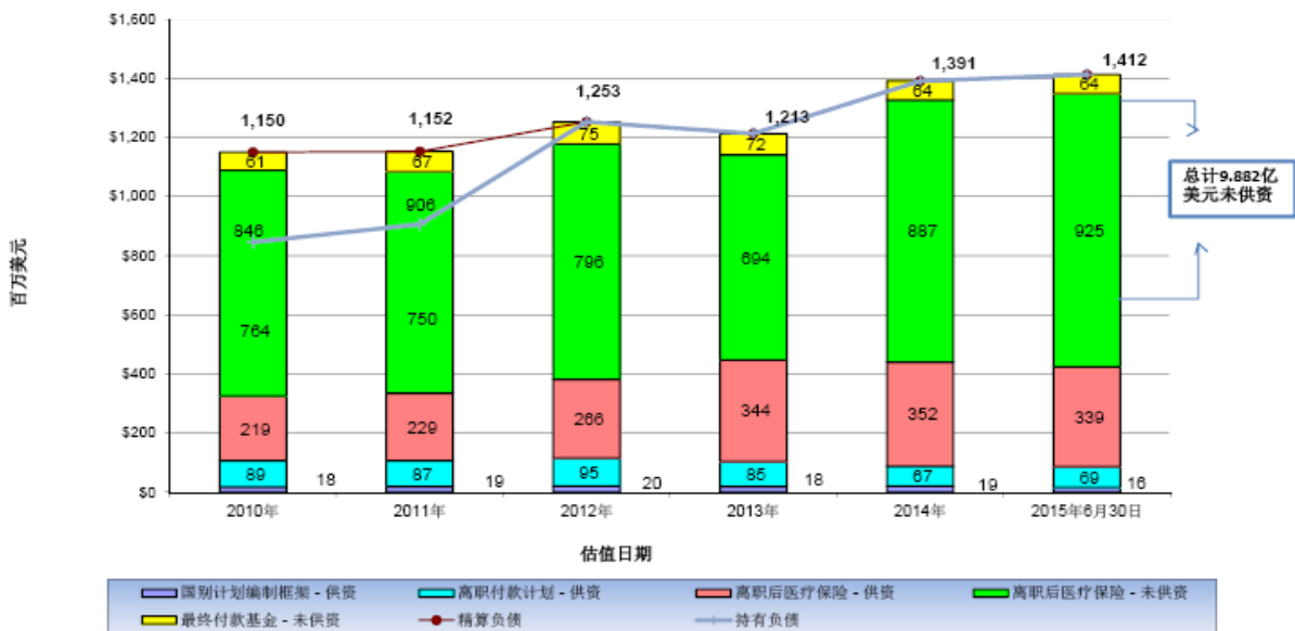
职工相关负债：过去5.5年按计划 and 供资状况划分的总负债