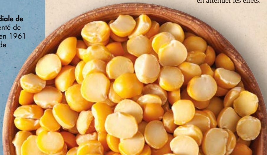
POIS CULTIVÉ ( PISUM SATIVUM )

Les légumineuses sont intelligentes face au climat: elles ont non seulement la capacité de s'adapter au changement climatique mais elles contribuent aussi à en atténuer les effets.