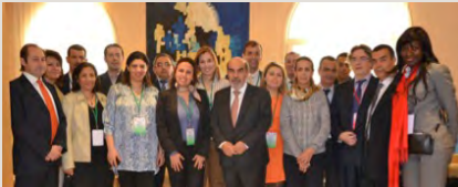
Le personnel du bureau sous-régional de la FAO pour l'Afrique du Nord suite à une réunion avec le Directeur Général de la FAO

Organes de gouvernance de l'Organisation, les conférences régionales jouent un rôle capital pour garantir l'efficacité et le suivi des actions de la FAO sur le terrain, et définir ses priorités. Le Bureau sous-régional pour l'Afrique du nord a connu une actualité riche et dense à travers sa participation à la 32 ème Conférence Régionale pour le Proche-Orient et l'Afrique du Nord qui a eu lieu à Rome du 24 au 28 février 2014. Il a aussi contribué activement à l'organisation de la 28 ème Conférence Régionale pour l'Afrique qui avait pour pays hôte la Tunisie. Ce premier numéro de l'année se focalise essentiellement sur les résultats de ces deux événements majeurs. Tous les détails en matière de communications, de rapports, de photo reportage, de communiqués de presse et de retombées médias figurent sur les sites respectifs de ces conférences.