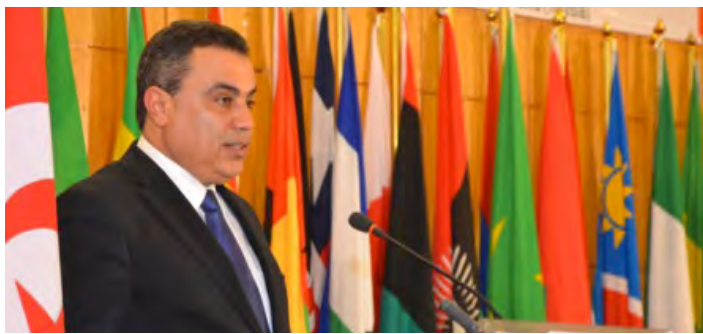
Mr Mehdi Jomâa, Chef du gouvernement tunisien prononçant son discours lors de la cérémonie d'ouverture de la Conférence Régionale pour l'Afrique