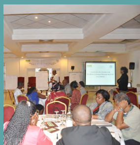
Restitution des travaux de groupe de la consultation pour la société civile

Suite à la mise en place par la FAO du Cadre stratégique de partenariat avec la société civile, une consultation dédiée à la société civile en Afrique s'est tenue à Tunis, les 21 et 22 mars 2014. Organisée sous l'initiative de l'Organisation Panafricaine des Agriculteurs (PAFO) et de l'Union Magrêbine et Nord Africaine des Agriculteurs (UMNAGRI) plusieurs représentants d'organisations paysannes, d'éleveurs, de pêcheurs, de consommateurs et de mouvements