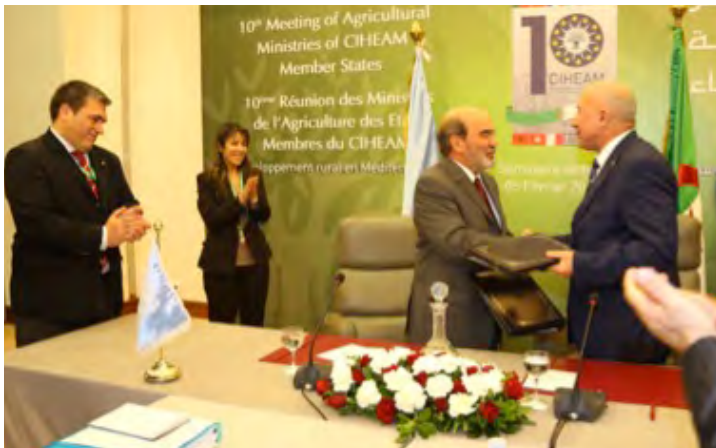
Signature d'une convention d'intention pour le renforcement du rôle de la FAO en Algérie

L'Algérie a signé avec l'Organisation des Nations unies pour l'alimentation et l'agriculture (FAO) une déclaration d'intention afin de renforcer le bureau de la FAO en Algérie en le transformant en un bureau de partenariat et de liaison d'une part, et pour mettre en place un programme de partenariat entre l'Algérie et l'Organisation pour la mise en œuvre de projets de coopération technique au niveau national et régional notamment à travers la coopération sud-sud dans les domaines de l'agriculture, la foresterie, la pêche et la protection de l'environnement