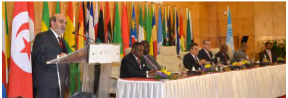
Mr José Graziano Da Silva, Directeur Général de la FAO aux travaux de la 28 ème Conférence Régionale pour l'Afrique

La Conférence régionale de la FAO pour l'Afrique (ARC) qui s'est tenue à Tunis du 24 au 28 mars 2014 a rassemblé 38 ministres et 245 délégués de 49 pays. Etaient aussi présentes deux agences des Nations Unies, deux États avec un statut d'observateur, 16 Organisations Internationales Gouvernementales et Organisations Internationales non Gouvernementales (OIG/OING), le Nouveau Partenariat pour le développement de l'Afrique (NEPAD) de l'Union Africaine et la Banque Africaine de Développement. Treize organisations non gouvernementales représentant la société civile étaient aussi présentes.