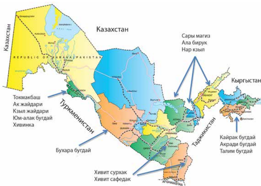
Рисунок 2. Староместные сорта пшеницы, обнаруженные в ходе обследований, проведенных в Узбекистане в период с 1920 по 1950 г. (Удачин и Шахмедов, 1984)