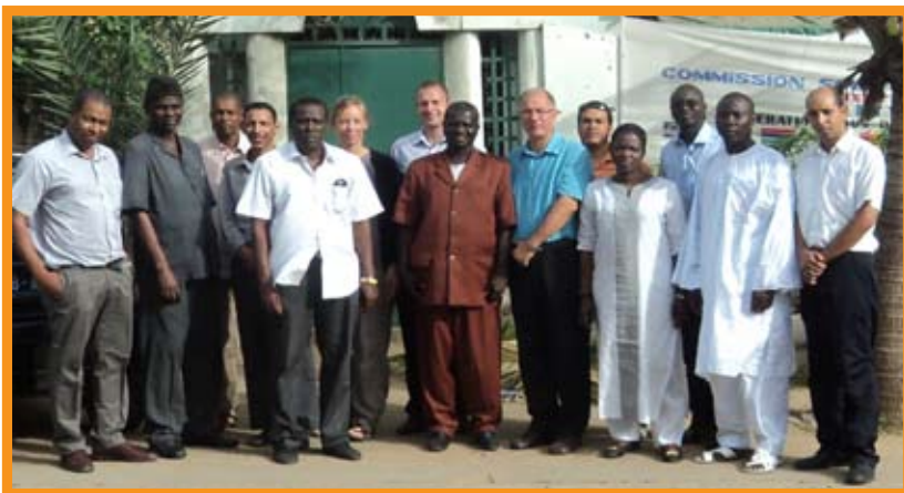
Survey Data Analysis and Nansis Database Training Course Participants Les participants à la formation sur l'analyse des données d'enquête et sur la base de données Nansis

Eleven scientists from all seven countries in the Canary Current Large Marine Ecosystem (CCLME) area have undergone training in Dakar, Senegal from 20 to 26 October 2010 in the use of the Nansis database and survey data analysis tool. The course included installation and use of the Nansis database, survey setup and biomass estimation from swept area and also from acoustic surveys. It also included lectures in survey methodology, limitations and post survey analyses of survey data for assessment purposes. This is the third in the series of courses on survey data analysis and Nansis organized by the EAF-Nansen project. The first two were held in Accra, Ghana (2008) and Port Louis, Mauritius (2009).