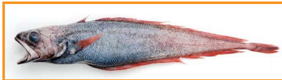
Physiculus cyanostrophus