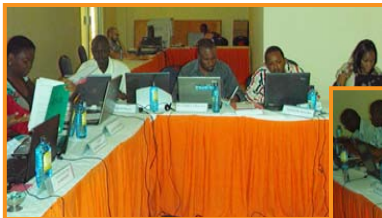
Some of the participants of the Mombasa stock assessment course at work Quelques-uns des participants au travail au cours de la formation sur l'évaluation des stocks de poissons, tenue à Mombasa

models to data; Critical aspects of practical fish stock assessment. The course was led by Pedro Barros with assistance of Tarub Bahri (both of FAO). Mr Dale Kolody of the Indian Ocean Tuna Commission (IOTC) was invited to have a session in the training and presented an overview of the general characteristics and most problematic issues in pelagic fisheries from a stock assessment perspective (e.g. widespread international fisheries with mixed species targeting, poorly quantified spatial stock structure, reliance on commercial CPUE as a relative abundance index) and large-scale tagging programmes.