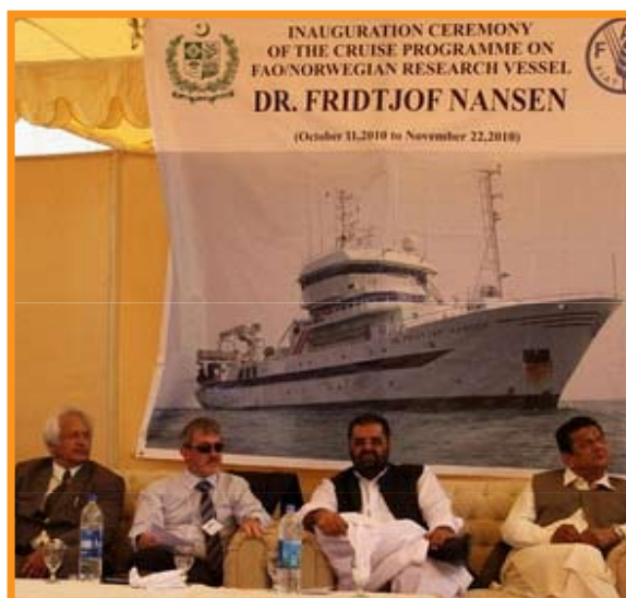
Inauguration ceremony in Karachi on 11 October 2010 La cérémonie d'inauguration à Karachi le 11 Octobre 2010

la première fois que le navire, âgé de 16 ans, quitte les eaux africaines, ce ne sera pas la première fois que le navire visitera le Pakistan. En effet, le premier navire Dr Fridtjof Nansen (1974-1993) avait effectué dans les mêmes eaux, entre 1975 et 1976, une campagne analogue. Le projet fait partie d'un programme plus vaste, le "Programme d'enquête sur l'évaluation des stocks dans la ZEE du Pakistan", mis en œuvre par le Département des pêches maritimes du Pakistan (MFD), basé sur un financement conjoint du gouvernement pakistanais et de l'ambassade de Norvège au Pakistan. Le navire sera de retour dans les eaux africaines début