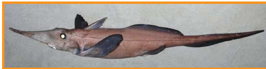
Rhinochimaera cf africana