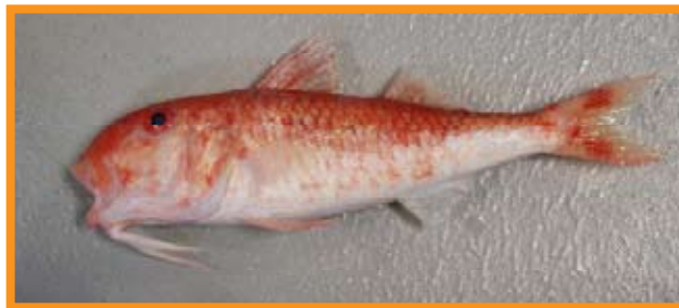
Parupeneus nansen

Lors d'une enquête similaire dans les eaux profondes sur le tombant du plateau au large du Ghana, plusieurs espèces extrêmement rares, y compris les deux ci-dessous, ont été répertoriées.