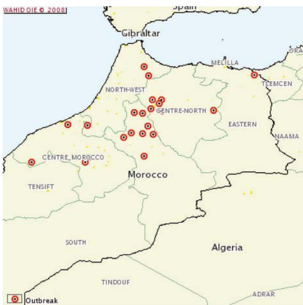
20 Juillet – 31 Juillet : 41 foyers en 12 jours