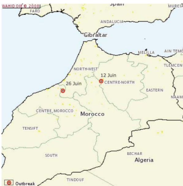
12 Juin et 26 Juin : 2 foyers reportés 15 jours