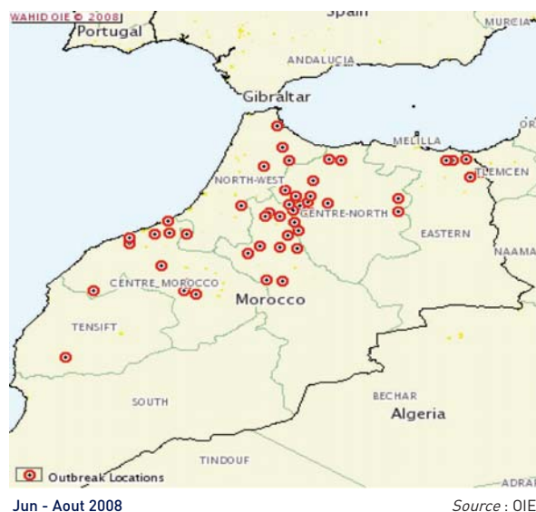
Figure 1. Foyers de PPR en 2008 au Maroc

Rétrospectivement, le premier cas peut être daté du 12 juin 2008 dans la commune rurale d'Ain Chkef, Moulay Yacoub, non loin de Fès. Confirmé par des tests de laboratoire le 18 juillet, il a été officiellement déclaré à l'OIE le 23 juillet 2008. La propagation a été rapide. Le 4 août, 92 foyers avaient déjà été rapportés par les services vétérinaires marocains, dont 25 pour les 5 derniers jours.