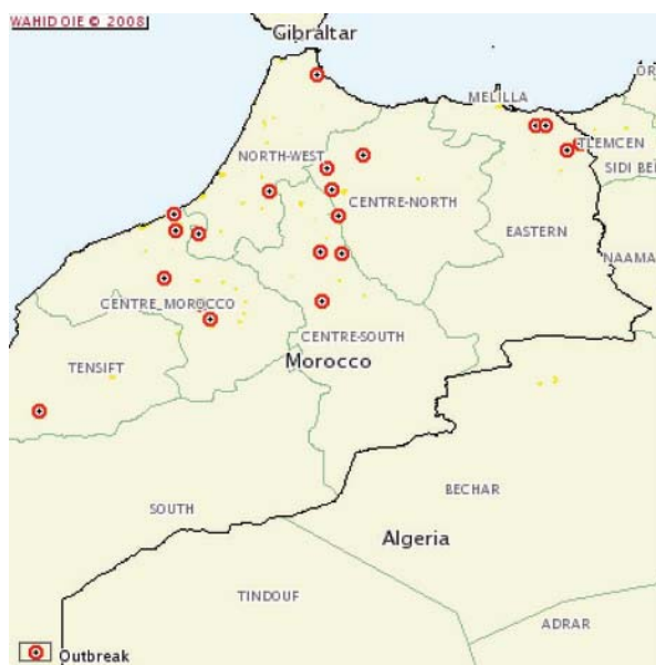
31 Juillet - 4 août : 25 foyers en 5 jours