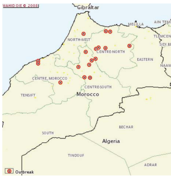
30 Juin – 19 Juillet : 24 foyers en 20 jours