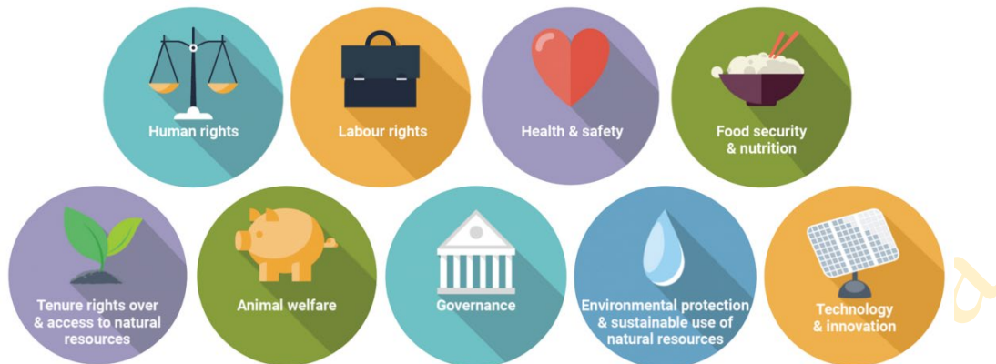
Figura 2. Áreas claves de riesgo y desarrollo descritas en la Guía de la OCDE-FAO para cadenas de suministro agrícola responsables

12. El trabajo que la FAO, sobre el desarrollo de la CER, refleja los principios fundamentales de la estrategia del sector privado de la FAO y forma parte del Programa Global CFS-RAI de apoyo a las inversiones responsables en agricultura y sistemas alimentarios, donde está interrelacionado con los principales áreas de trabajo de la FAO, incluidos: 3