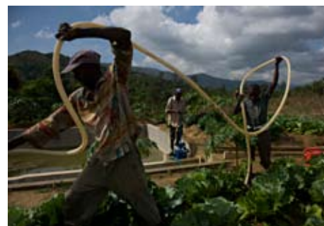
Un an après le tremblement de terre, des agriculteurs haïtiens arrosent leurs cultures avec une pompe à pédale.

La FAO administre des programmes de protection et de relèvement des moyens d'existence agricoles. Ses activités d'urgence comprennent l'achat de biens, tels que