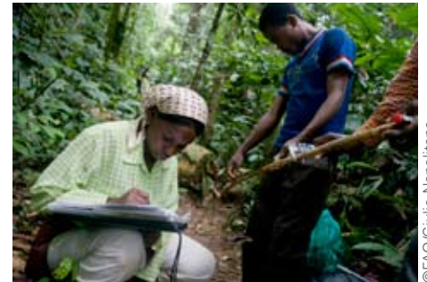
Formation d'hommes et de femmes dans la foresterie.