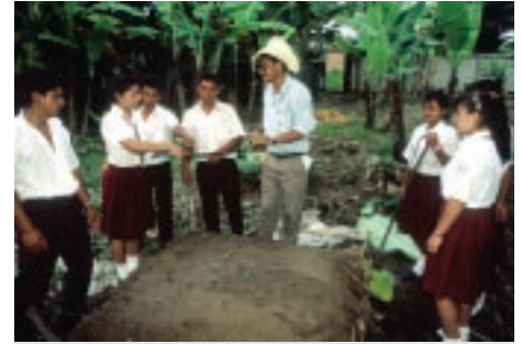
حديقة مدرسية في أمريكا الوسطى.