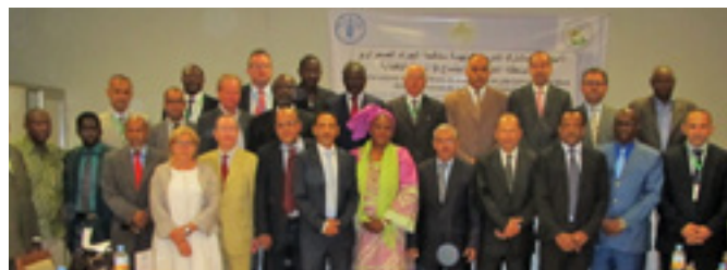
Participants à la 7ème Session de la CLCPRO

La septième session de la Commission de lutte contre le criquet pèlerin dans la région occidentale (CLCPRO) s'est tenue à Nouakchott du 22 au 26 juin 2014. Ces sessions ordinaires ont pour objectifs de définir les orientations stratégiques de la CLCPRO, d'examiner les comptes annuels de son fonds fiduciaire géré par la FAO et d'établir le programme de travail et le budget du prochain biennium. Le point principal de son ordre du jour portait sur les questions institutionnelles relatives à (i) la révision des rôles et responsabilités de la CLCPRO pour lui donner plus d'autonomie tout en restant dans le cadre de la FAO et (ii) la mise en œuvre de mécanismes de financement durables de la lutte contre le criquet pèlerin dans la région. Les délégués des Etats membres ont approuvé la redéfinition des fonctions du Président, du Comité exécutif et du Secrétaire exécutif de la CLCPRO en vue d'une plus grande appropriation par les pays de leur Commission. Concernant les mécanismes de financement de lutte contre le criquet pèlerin, les délégués ont approuvés notamment un système de financement aligné sur la dynamique d'évolution des populations du criquet pèlerin. Ce système met en exergue les financements nationaux, la solidarité régionale, la coopération sud-sud et l'appui des institutions régionales (UEMOA, CEDEAO...). Le premier instrument de financement est celui du budget des Etats avec l'objectif d'une prise