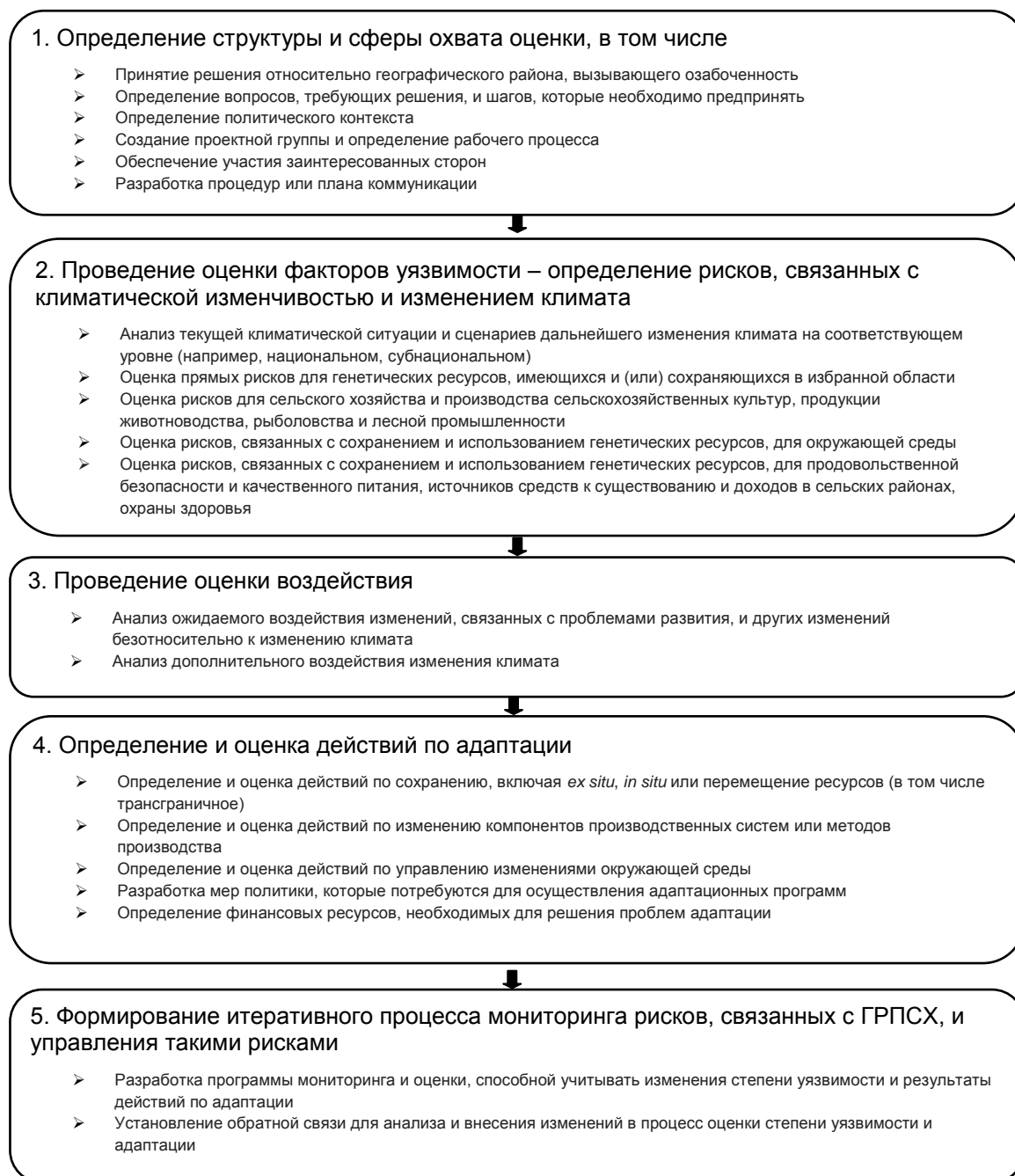
Рис. 2. Проведение оценки рисков и факторов уязвимости

30. Оценка должна проводиться с учетом рисков, связанных как с сохранением, так и с использованием ГРПСХ. Ресурсы, которые находятся в зоне риска и в отношении которых не принимаются меры по их сохранению, становятся недоступны для дальнейшего использования, что может ограничить варианты действий по адаптации. Оценка риска и факторов уязвимости должна включать оценку рисков, связанных с генетическим разнообразием в системе