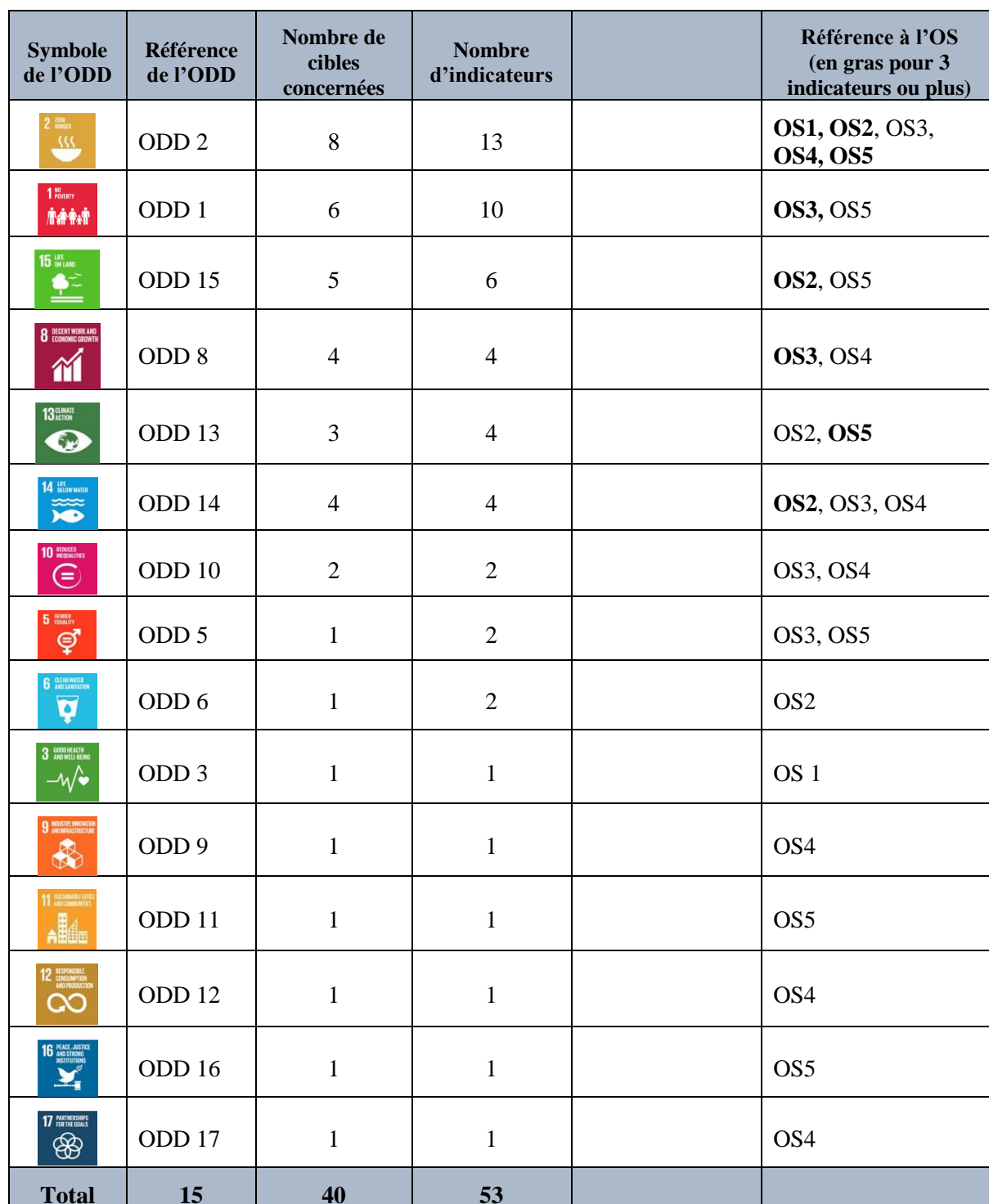
Figure 1: Cibles et indicateurs des ODD inclus dans le cadre de résultats 2018-2021 au niveau des objectifs stratégiques