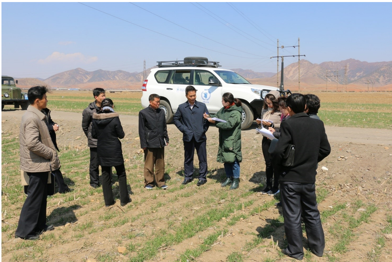
Visite de l'équipe d'évaluation FAO/PAM dans une coopérative agricole dans le comté de Pongsan, Province d'Hwanghae du Nord, avril 2019.

Les catégories urbaines et rurales appliquées au cours de cette évaluation sont fondées sur l'examen officiel des ménages interrogés et les statistiques officielles. Il convient de noter qu'en RPDC, la délimitation entre zones urbaines et rurales n'est pas clairement définie par la densité de population ou des infrastructures, mais par l'administration qui contrôle une zone donnée. Si elle relève de l'administration "Up", la zone est considérée comme urbaine. Si elle relève de l'administration "Ri", la zone est considérée comme rurale. Nombre de zones "Up" visitées pourraient être considérées comme rurales en raison de leur emplacement géographique et des moyens de subsistance qui les caractérisent. La Mission a par conséquent décidé de ne pas présenter les résultats en les ventilant selon les zones urbaines et rurales dans le présent rapport.