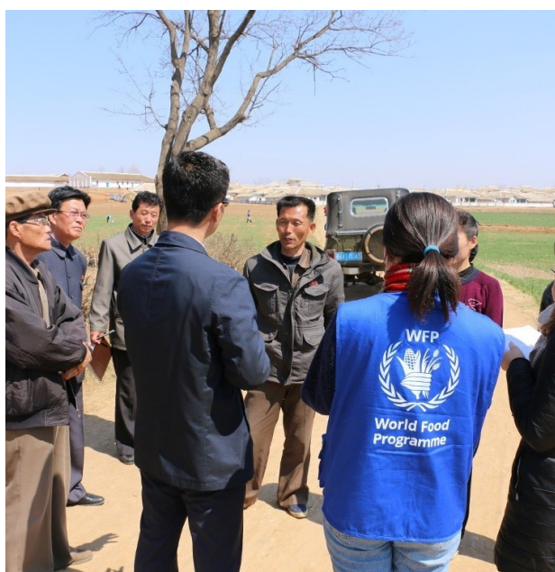
Visite de l'équipe d'évaluation FAO/PAM dans une coopérative agricole dans le comté de Sinchon, Province d'Hwanghae du Sud, avril 2019.