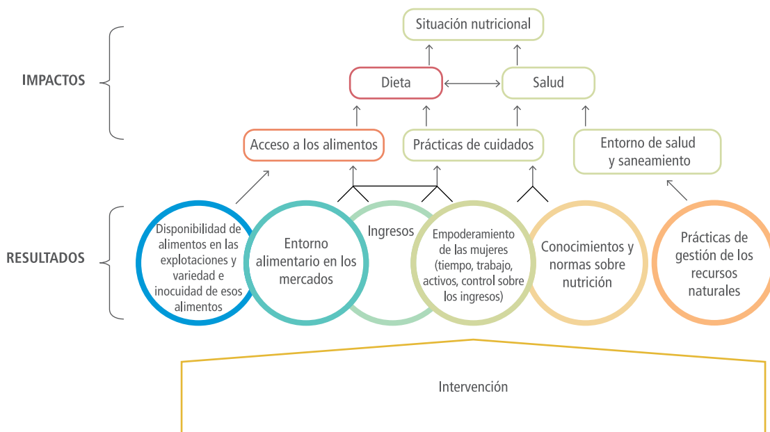
Gráfico 1. Marco de presentación simplificada de las vías de impacto de los proyectos de inversión. En el presente marco se definen seis esferas de resultados que se ven directamente afectadas por la agricultura, el desarrollo rural y los sistemas alimentarios, y la forma en que se produce la influencia en la nutrición.