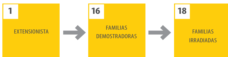
Figura 3: Intervención con las Familias Demostradoras

Para realizar estas funciones, se requiere que los hogares de las Familias Irradiadas se ubiquen en zonas cercanas a los hogares de las FD.