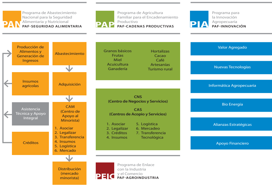
Figura 1: Estructura Plan de Agricultura Familiar

Las familias son el eje central del PAF, que pretende contribuir al empoderamiento de las comunidades rurales y facilitar los procesos que mejoren la gestión de su propio desarrollo, al mismo tiempo que fortalece el actual sistema de extensión del Centro Nacional de Tecnología Agropecuaria y Forestal (CENTA).