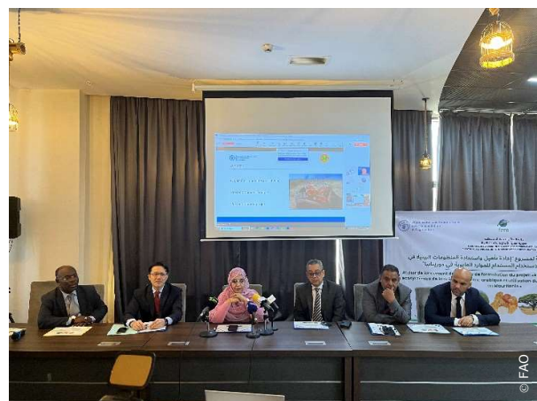
Atelier du projet de la restauration de la ceinture de la gomme arabique.

Le projet vise à restaurer les écosystèmes dégradés de la ceinture de la gomme arabique, (i) à promouvoir des pratiques durables de gestion forestière, (ii) à développer des outils de suivi et de gestion des données, et (iii) à valoriser la filière gomme arabique ainsi que d'autres produits forestiers non ligneux d'importance économique grâce à une approche axée sur la chaîne de valeur et l'entrepreneuriat vert.