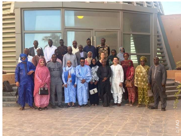
Le personnel de la FAO Mauritanie durant l'atelier de Team Building.

Les activités participatives ont permis aux participants de renforcer leurs liens, mieux se connaître, découvrir leurs forces respectives, explorer les profils de personnalité pour optimiser la collaboration, et engager des discussions stratégiques sur l'amélioration du fonctionnement du bureau.